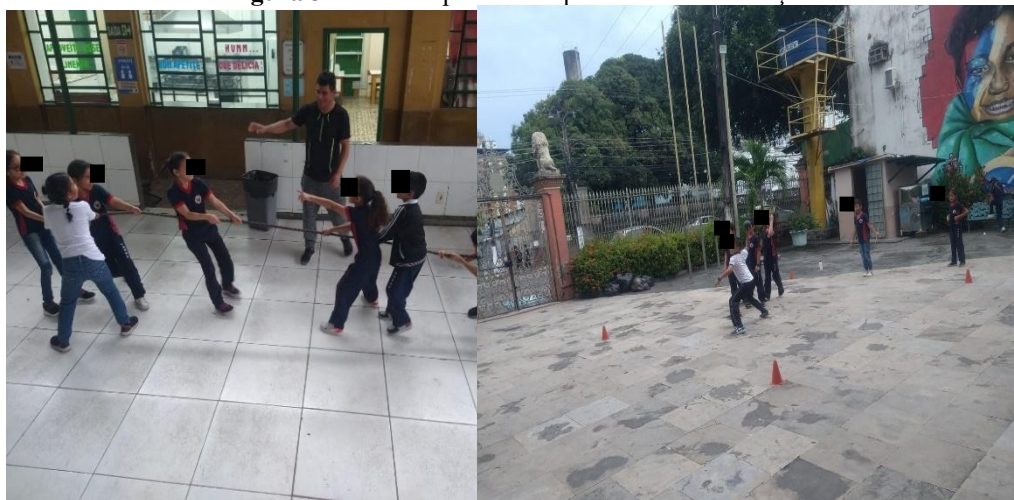
Figura 3 - Áreas improvisadas para aulas de Educação Física