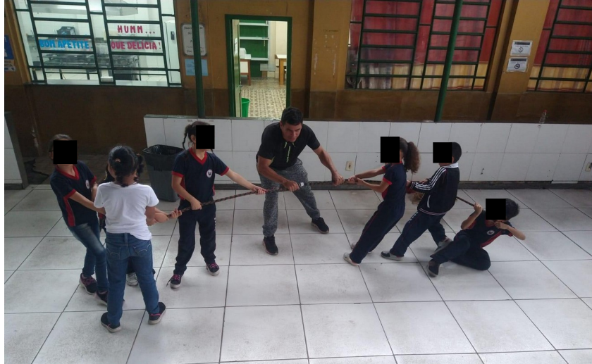
Figura 4 - Atividade “cabo de aço

Para melhorar a sinalização e a organização, utilizamos um apito para marcar os comandos, tornando a comunicação mais eficaz e visual. Além disso, passamos a realizar as atividades junto aos alunos, demonstrando cada etapa da brincadeira e proporcionando um modelo a ser seguido. Conforme demonstrado nas Figuras 4 e 5.