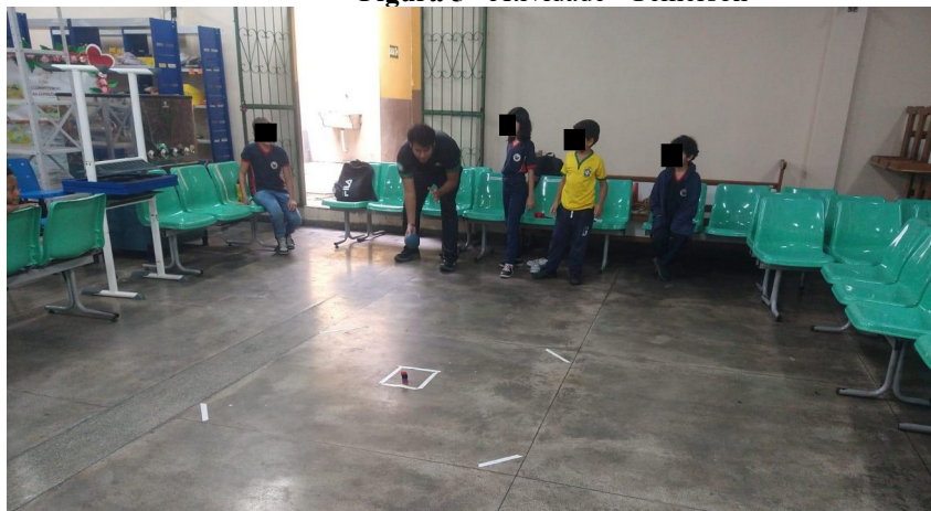
Figura 5 - Atividade “Gemerson”