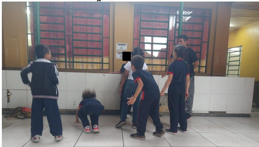
Figura 1 - Brincadeira "boca de forno".

ao executar os movimentos, como se temessem errar ou se expor na frente dos colegas. Essa resistência foi um fator que dificultou a participação ativa e a aprendizagem da brincadeira “Boca de Forno”. Na Figura 1, é ilustrada a realização da brincadeira com os alunos.