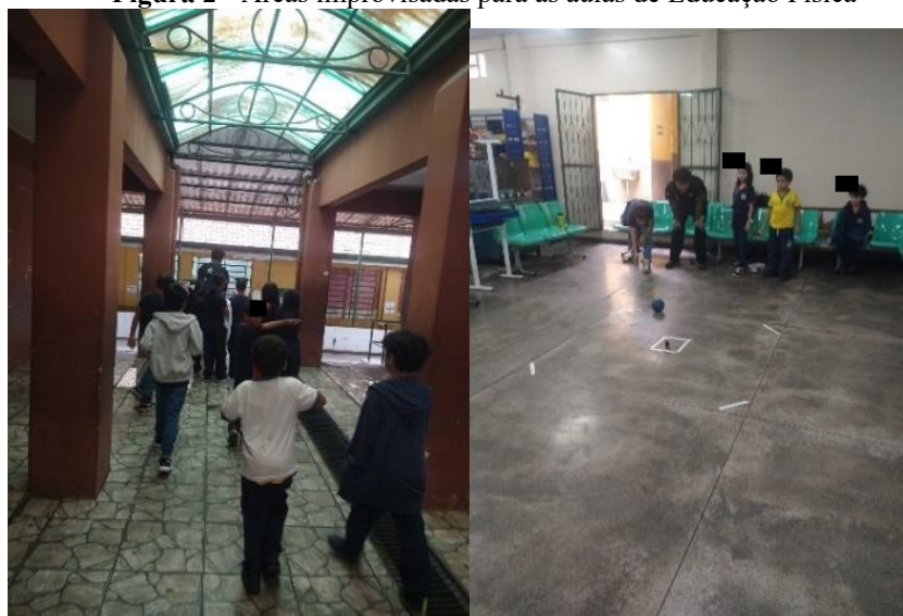
Figura 2 - Áreas improvisadas para as aulas de Educação Física

limitava ainda mais as opções de espaço para realizar as atividades. As Figuras (2) e (3), apresentam as áreas improvisadas das aulas de Educação Física.