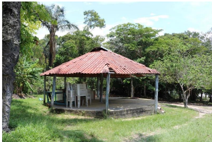
Figura 13. Chapéu de palha.

Há uma estrutura que os entrevistados chamam de chapéu de palha na comunidade (Figura 13), onde alguns moradores produziam e vendiam seus artesanatos quando havia demanda. Nesse espaço, era ensinado o processo de produção e era possível receber os turistas.