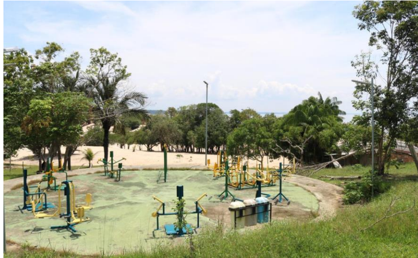
Figura 6. Academia ao ar livre.