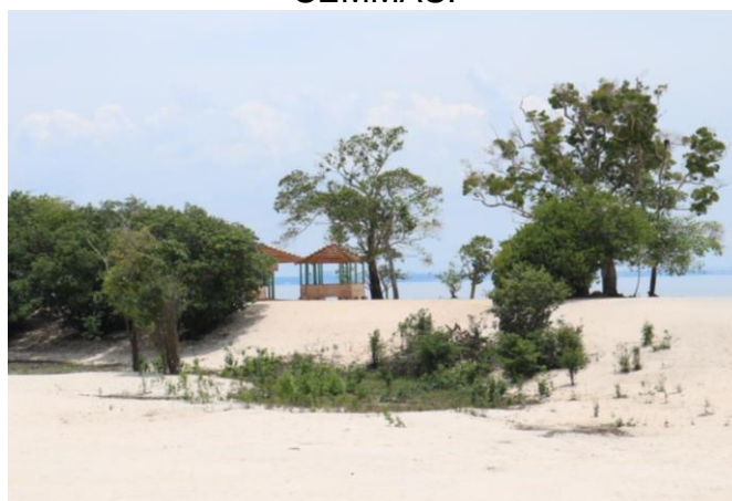
Figura 10. Barracas reformadas pela SEMMAS.