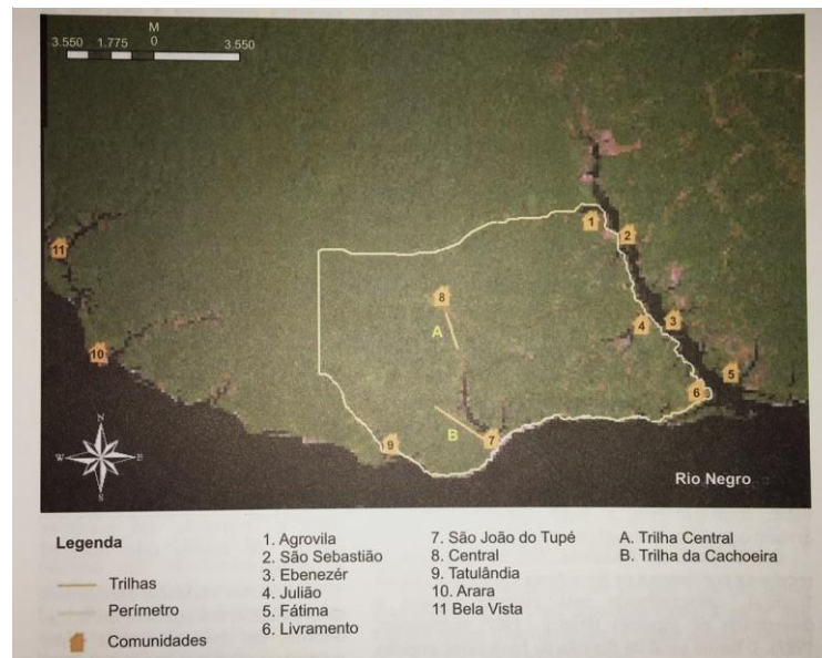
Figura 1. Limites e localização das comunidades existentes na RDS do Tupé e seu entorno.

“A Reserva de Desenvolvimento Sustentável do Tupé localiza-se na margem esquerda do rio Negro, a oeste de Manaus, distante aproximadamente 25km em linha reta do centro da cidade, a uma altitude média de 20m a.n.m.” (SCUDELLER et al. 2005, p. XII).