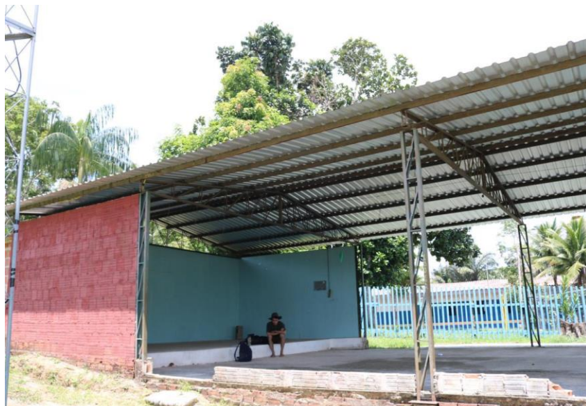
Figura 7. Área para reuniões.