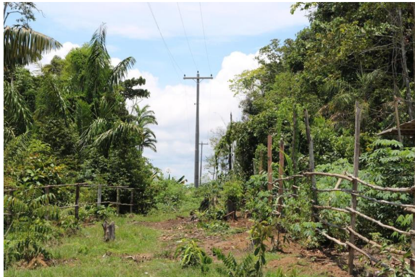
Figura 12. Trilha da Comunidade São João do Tupé.

Outro atrativo identificado foi a presença de uma trilha (Figura 12), que conforme afirma uma moradora, começa na comunidade e vai até uma cachoeira, localizada próximo ao lago do Tupé.