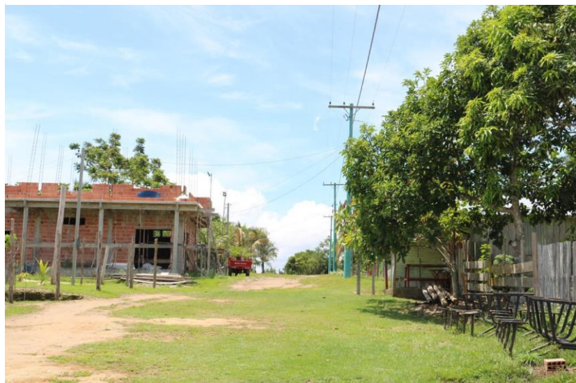
Figura 2. Comunidade São João do Tupé.

A comunidade São João do Tupé (Figura 2) é uma das seis comunidades que integra a Reserva de Desenvolvimento Sustentável do Tupé e está localizada na margem esquerda do rio Negro, na zona rural do município de Manaus.