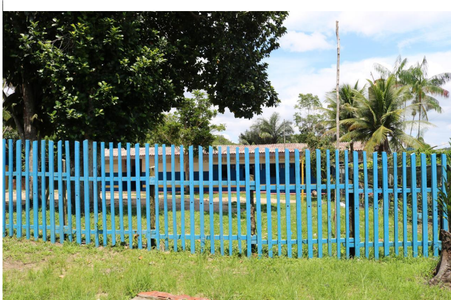
Figura 4. Escola Municipal

Com relação à estrutura, a comunidade possui uma escola municipal (Figura 4), um posto de saúde (Figura 5), uma academia ao ar livre (Figura 6), um campo de futebol, igrejas e uma área destinada para encontros e reuniões dos comunitários e/ou visitantes (Figura 7).