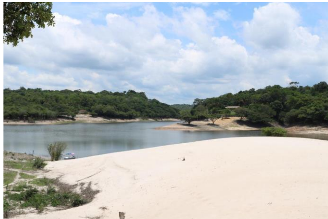
Figura 9. Praia do Tupé.

A partir da visão dos comunitários, pode-se identificar como atrativos a praia do Tupé (Figura 9), que possui barracões de madeira atendendo à visitação e quando a unidade passou para gestão da SEMMAS, essas construções passaram por reformas (Figura 10), melhorando a estrutura das mesmas; e o artesanato (Figura 11), que está diretamente ligado à cultura local e os moradores utilizam de recursos para produzir ornamentos referentes a sua cultura.