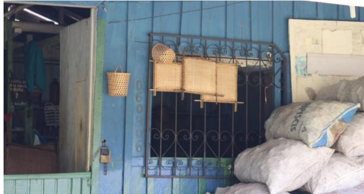
Figura 11. Artesanato.