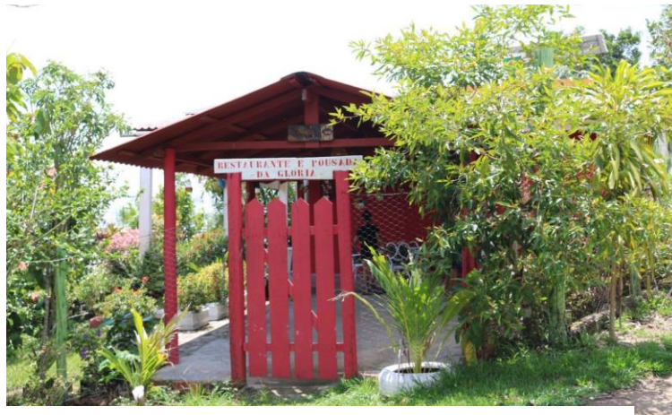
Figura 8. Restaurante e Pousada.

As estruturas atendem às necessidades básicas da população tradicional. A comunidade também dispõe de armazinhos e pequenos mercadinhos que fornecem produtos para as pessoas que ali residem. Além dos já citados, existe uma estrutura voltada para a realização da atividade turística que conta com meios de hospedagem e pequenos restaurantes (Figura 8).