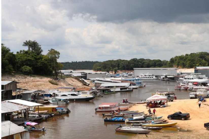
Figura 3. Marina do Davi

O acesso à comunidade é somente por meio fluvial, sendo necessário navegar pelo rio Negro durante aproximadamente 30 minutos em uma lancha, partindo da Marina do Davi (Figura 3) localizado na Ponta Negra, zona oeste de Manaus.