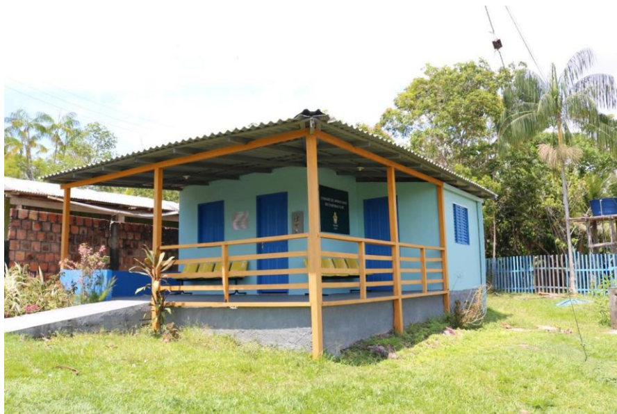
Figura 5. Posto de Saúde.