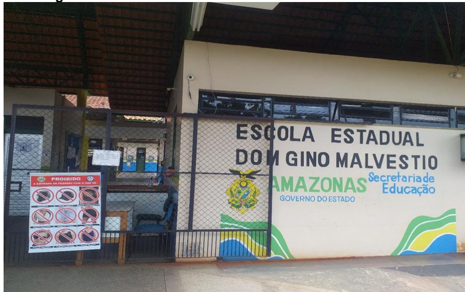
Figura 01: Escola Estadual Cívico Militar “Dom Gino Malvestio”.