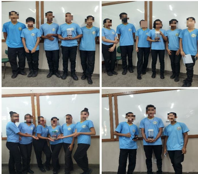
Figura 06: Apresentação sobre os Ciclos Biogeoquímicos.

A sexta etapa da sequência didática, teve como primeiro momento da aula a apresentação dos alunos, referentes aos ciclos biogeoquímicos trabalhados durante as aulas anteriores, os grupos apresentaram em aproximadamente 5 minutos os seus respectivos terrários fechados (figura 06).