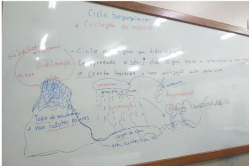
Figura 02: Aula teórica sobre os ciclos biogeoquímicos do oxigênio e nitrogênio.