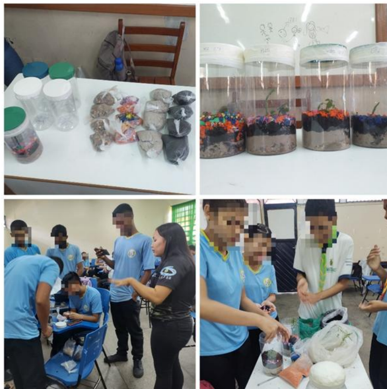
Figura 05: Aula prática: Construção de um terrário fechado como representação de um ecossistema.

Cada grupo ficou responsável por construir um terrário fechado, todos do grupo se envolveram e participaram ativamente com a atividade prática, todos os materiais necessários foram disponibilizados pela pesquisadora, alguns alunos não tiveram sucesso na germinação de suas leguminosas, mas o problema foi resolvido, pois outros alunos plantaram mais de uma leguminosa e compartilharam com os colegas (figura 05).