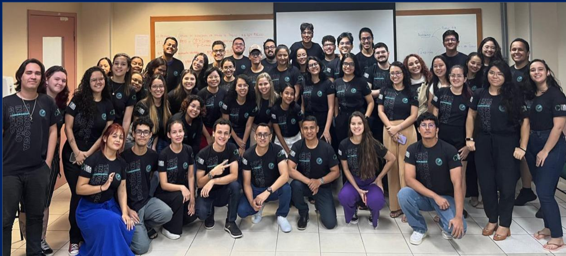
Turma Noturna de Finanças Corporativas Alunos envolvidos diretamente nas atividades do congresso