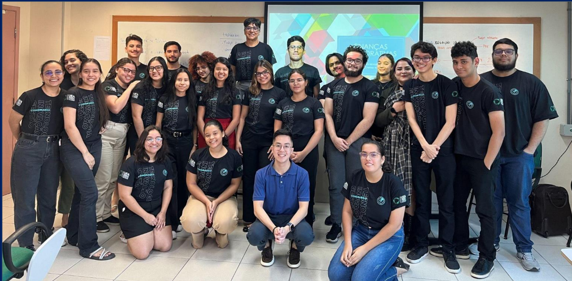
Turma Vespertina de Finanças Corporativas Alunos envolvidos diretamente nas atividades do congresso