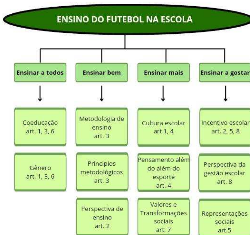
Figura 2 - Subtemas abordados na produção científica sobre o ensino do futebol na escola.

pedagógicos sugeridos por Freire (2011): ensinar futebol a todos; ensinar bem futebol a todos; ensinar mais que futebol a todos; ensinar a gostar do esporte.