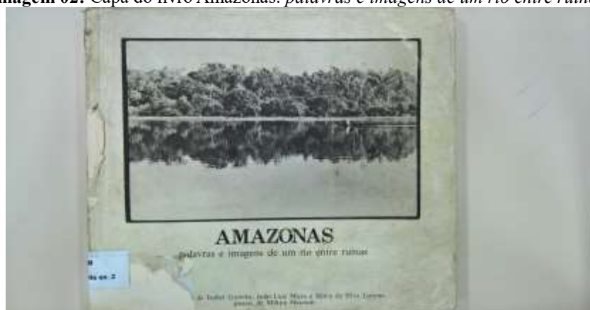
Imagem 02: Capa do livro Amazonas: palavras e imagens de um rio entre ruínas .