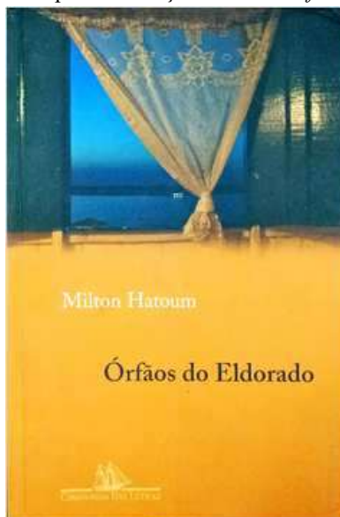
Imagem 01: Capa da 1ª edição do livro Órfãos do Eldorado

Na referida novela, o protagonista narrador, último representante da geração da família Cordovil, por meio de sua memória, narra o processo de decadência da referida família. No bojo da trajetória de Arminto Cordovil, aparece o amor por uma indígena: Dinaura. A figura misteriosa, enigmática de Dinaura, gera no enredo desta narrativa uma problematização histórica e historiográfica, provocada pela literatura de ficção: O processo de silenciamento das etnias indígenas e, principalmente, das mulheres, na História Oficial da Amazônia.