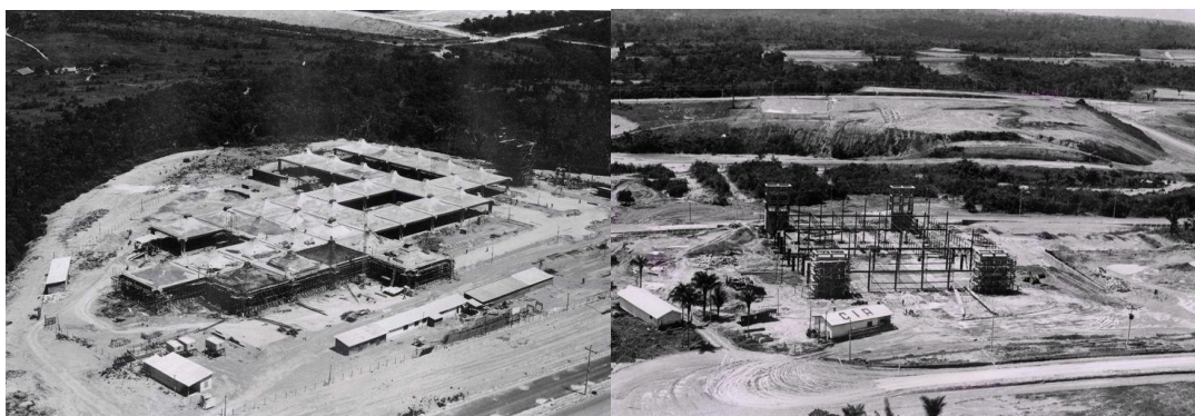
Figura 1: Construção da primeira fábrica do Distrito Industrial e prédio-sede da Suframa

Conforme destacado por Bomfim e Botelho (2009), os impactos econômicos gerados pela Zona Franca de Manaus (ZFM) superaram as estimativas inicialmente previstas em termos de arrecadação tributária e criação de empregos. Os investimentos implementados na ZFM provocaram uma transformação expressiva em Manaus, que, incluindo a população não residente, alcançou aproximadamente dois milhões de habitantes.