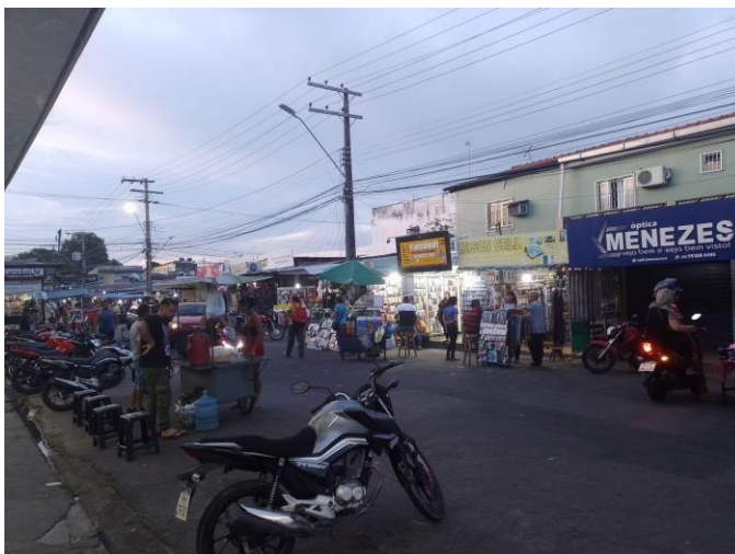
Figura 9: Feira livre da rua Cajubim do bairro São José Operário