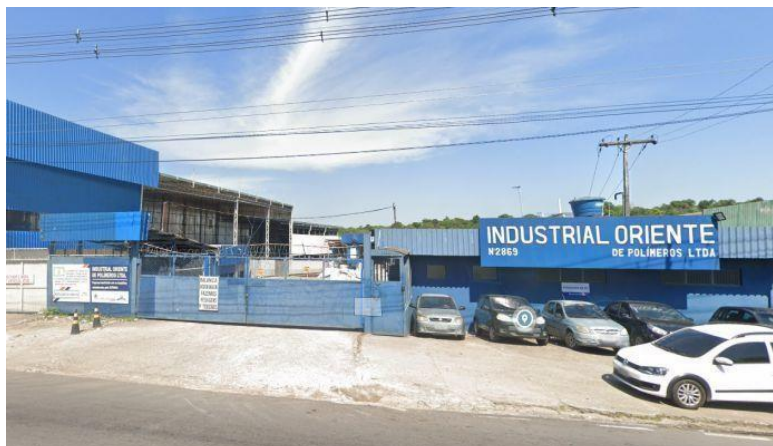
Figura 4: Empresa industrial na Avenida Autaz Mirim