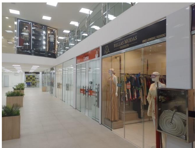
Figura 10: Complexo comercial na Avenida Autaz Mirim