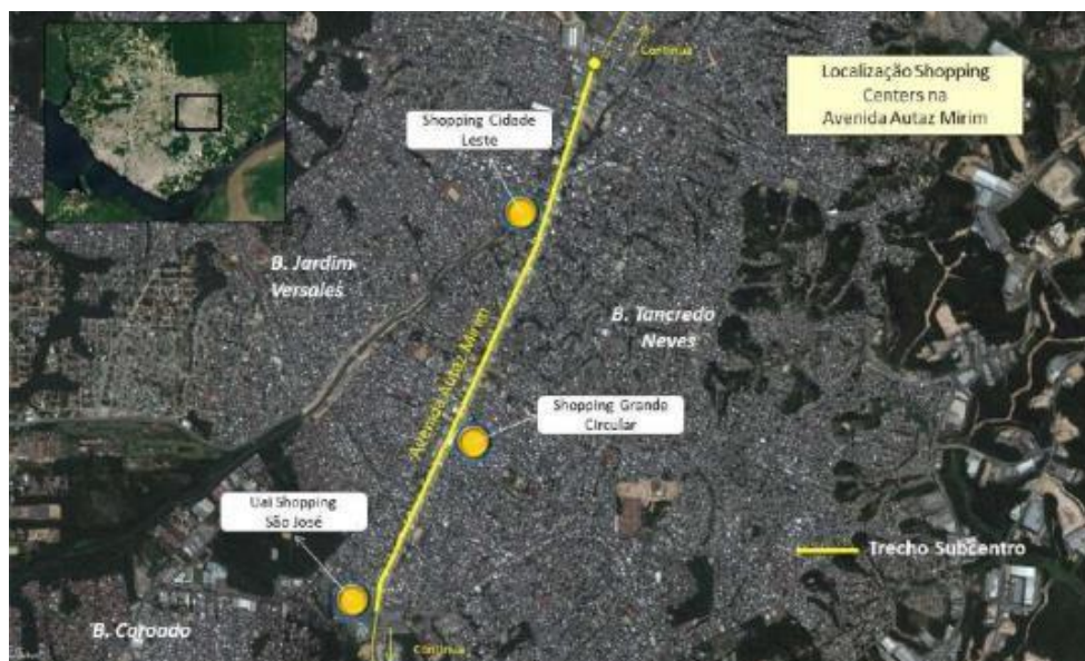
Figura 5: Localização dos shoppings centers ao longo da Av. Autaz Mirim

Fonte: imagem Google Earth, 2017. Organização, Tatiana Barbosa, 2017.