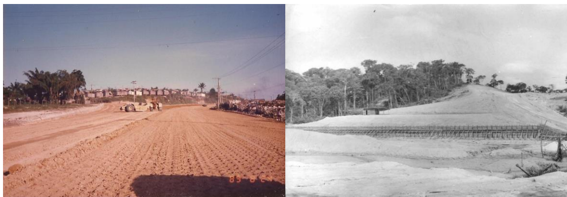
Figura 2: Abertura da Avenida Autaz Mirim.

topográficas e a presença ou ausência de construções pré-existentes. Um exemplo de investimento em infraestrutura e mobilidade urbana no contexto deste tipo de ocupação seria a própria Avenida Autaz Mirim, localizada na Zona Leste de Manaus, possibilitando o acesso posteriormente a pelo menos 11 bairros.