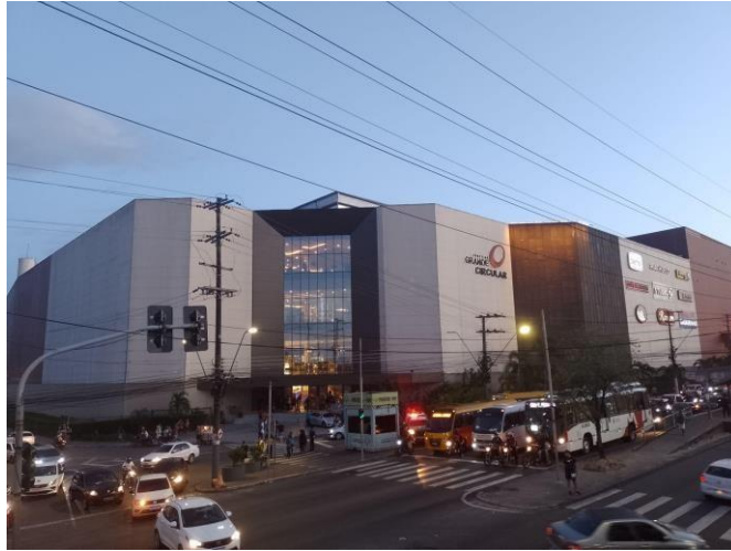
Figura 6: Shopping Grande Circular