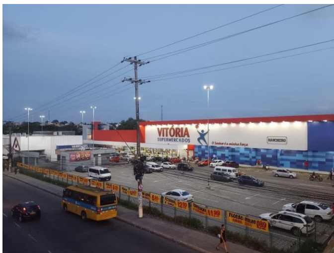
Figura 7: Supermercado varejista localizado na Avenida Autaz Mirim