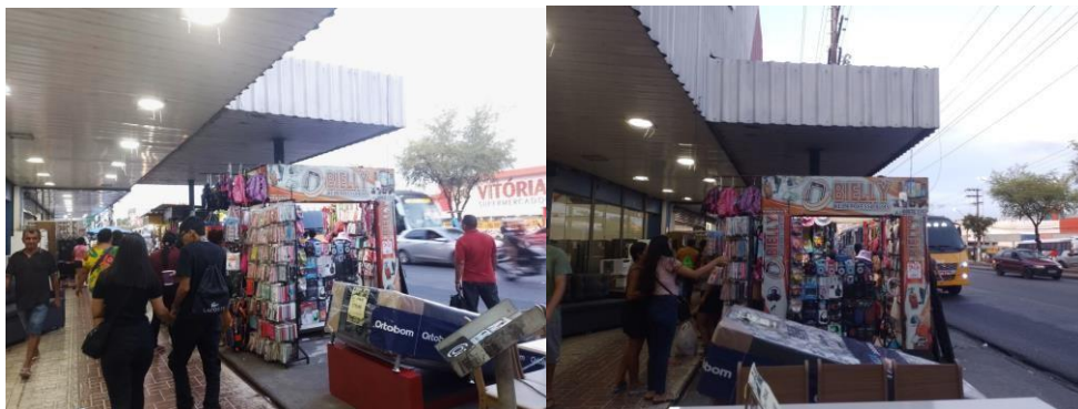
Figura 8: Camelôs e vendedores ambulantes na Avenida Autaz Mirim