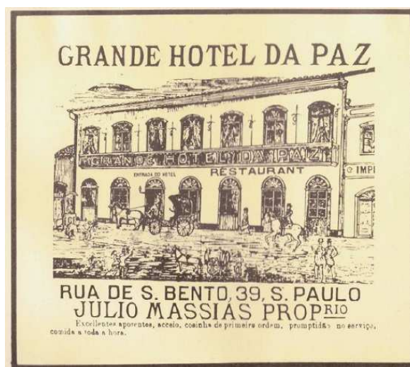
Figura 2: Grande Hotel da Paz, 1818.

O aumento pela busca por locais de hospedagem naquele período frente a chega numerosa de pessoas ao Rio de Janeiro frente a transferência da corte portuguesa à colônia do novo mundo, abriu espaço à atividade hoteleira. Outro ponto importante para o crescimento da atividade hoteleira no Brasil foi a abertura dos portos às nações amigas, uma vez que até então os albergues existentes não tinham muitas vagas, correspondiam a hospedagens precárias, atendendo aos visitantes eventuais de outras capitânias (CNC, 2005).