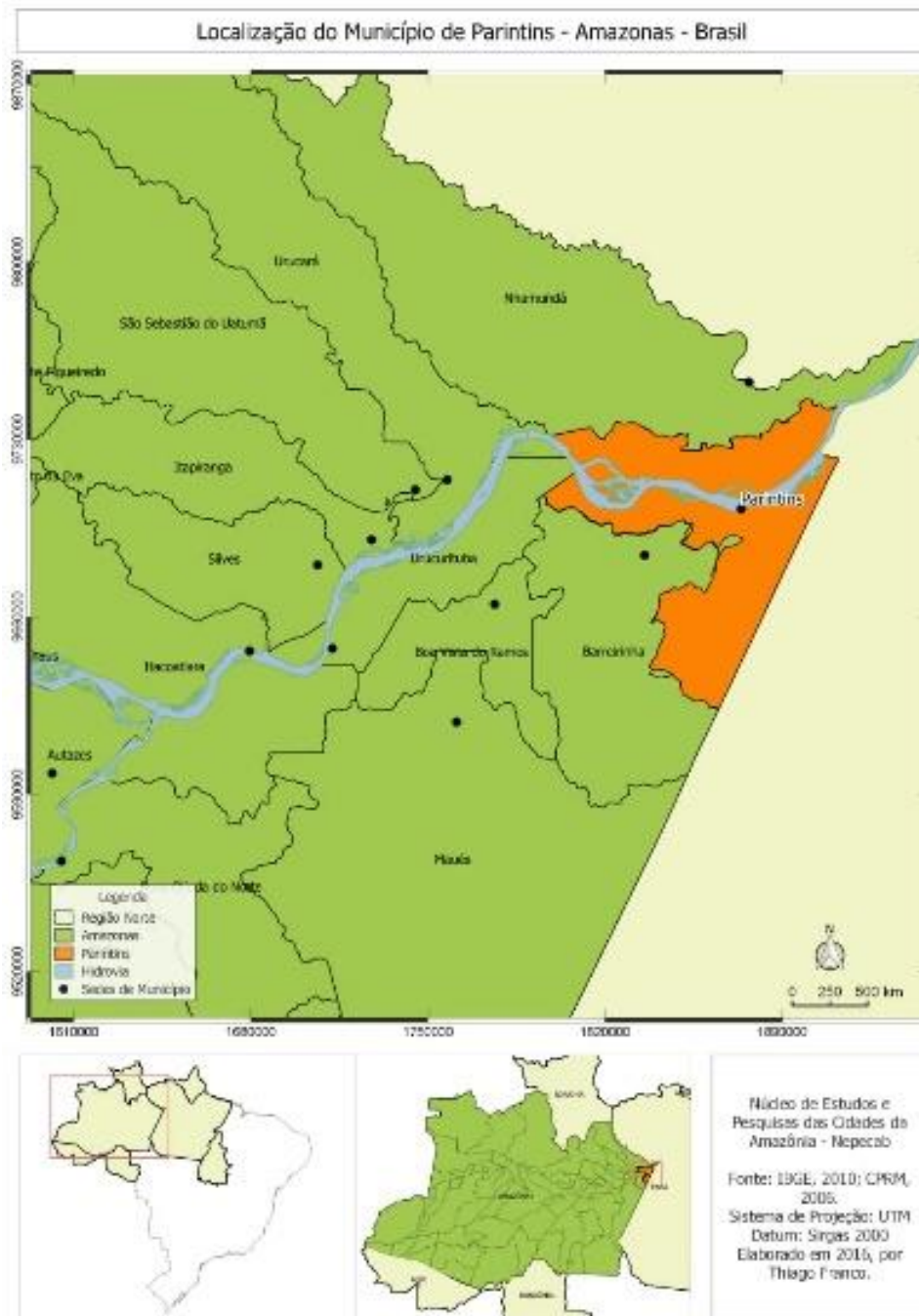
Figura 1: Mapa de localização da cidade de Parintins/AM