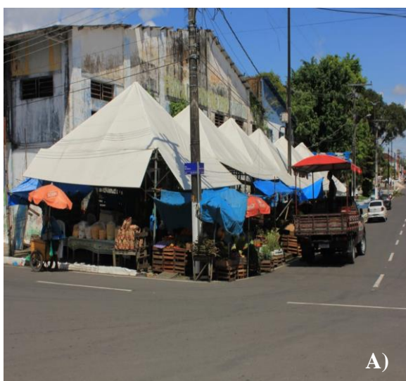
Figura 4: A) Feira do Produtor. B) Feira do Bagaço

Porém, o trabalho nas feiras livres pode ser desgastante, exigindo muita energia, esforço físico e habilidades para negociar e vender seus produtos. As figuras 6 e 7, demonstram o cotidiano dos feirantes.