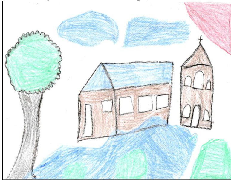
Figura 4 - As “ruas” da Ocupação Castanhal.