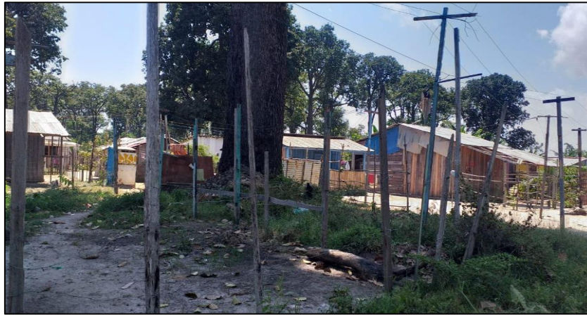
Figura 3 - Casas na Ocupação Castanhal.