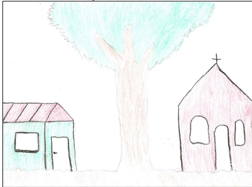
Figura 2 - A Castanheira