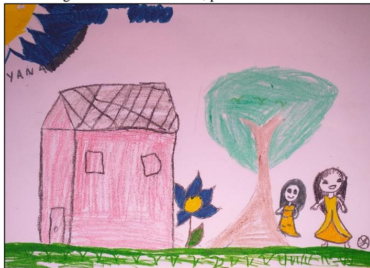
Figura 5 - O brincar livre, poética da infância.

O olhar de pesquisador/adulto se efetiva numa direção idealista de que há sempre uma realidade perfeita a ser atingida. Diante do intrigante desejo em focalizar aspectos que são tidos como essenciais, em um de nossos diálogos questionei se as crianças achavam que faltava algo na Ocupação. Uma delas acenou com a cabeça, e disse: nada, eu acho que nada... aqui a gente tem casa, a gente brinca de várias coisas com meus amigos, eu brinco na rua de pular corda e futebol.