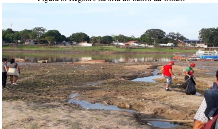
Figura 3: Registro na orla do bairro da União.

Abaixo, registros em imagens retiradas da orla do bairro da União: