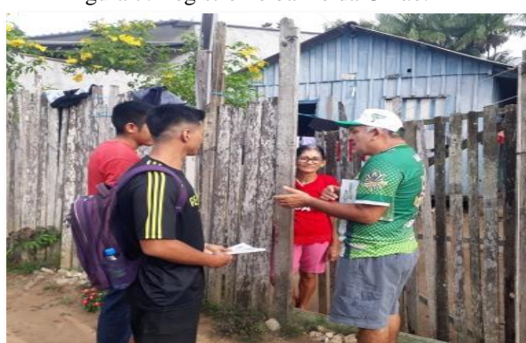
Figura 7: Registro no bairro da União.