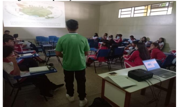
Figura 21: Aplicação da aula teórica da oficina.