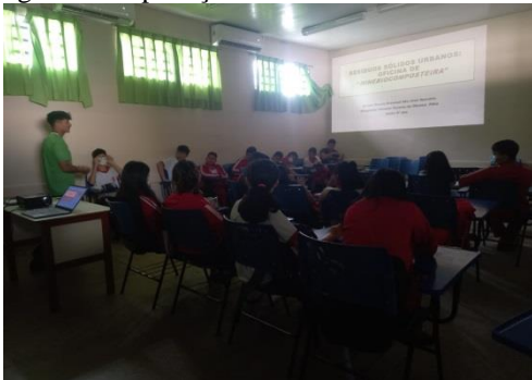
Figura 20: Aplicação da aula teórica da oficina.

Quase a turma toda, outros apenas não responderam; um ponto positivo foi que a maioria soube reconhecer os impactos negativos que o ser humano causa no meio ambiente, ressaltando em suas respostas as consequências negativas que podem causar futuramente.