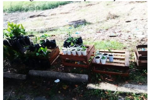
Figura 16: Mudas para doação.