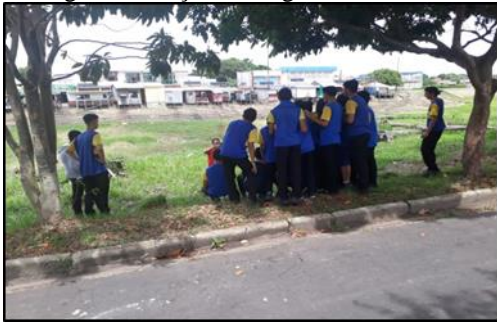
Figura 13: Ação na Lagoa da Francesa.

As imagens a seguir registram a ação de conscientização sobre o descarte de resíduos sólidos na lagoa da Francesa: