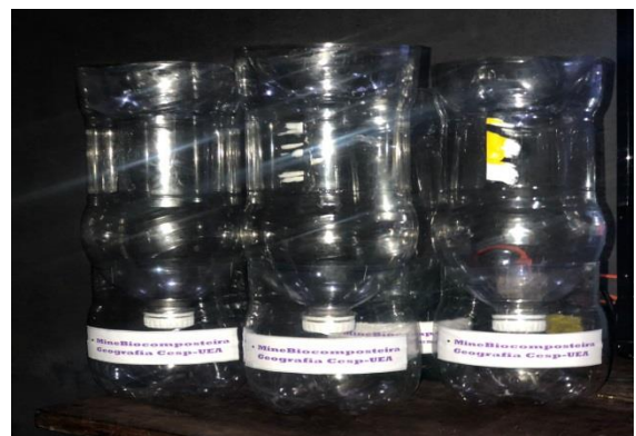
Figura 22: MiniBiocomposteira pré-montada.