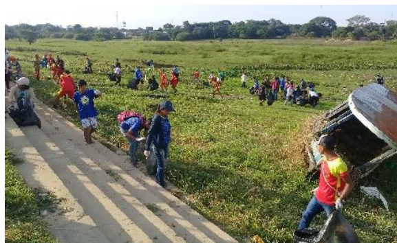
Figura 5: Registro na orla do bairro da União.