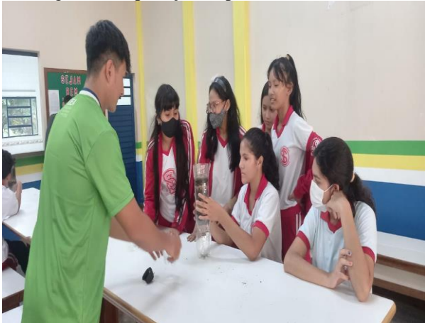
Figura 25: Aplicação da prática da oficina.