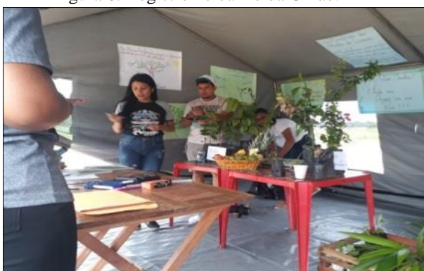
Figura 6: Registro no bairro da União.

Abaixo, fotos tiradas no bairro da União: