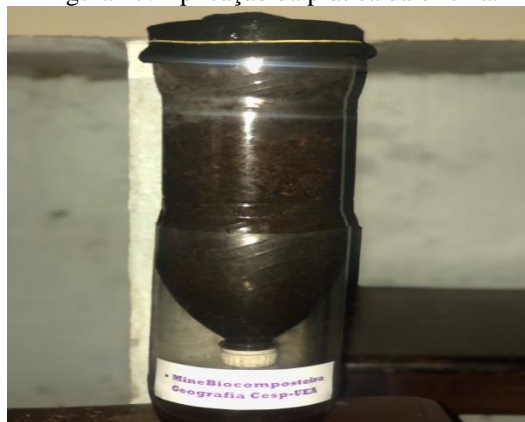
Figura 27: Aplicação da prática da oficina.