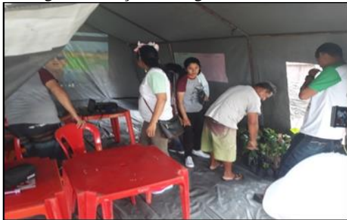
Figura 14: Ação na Lagoa da Francesa.