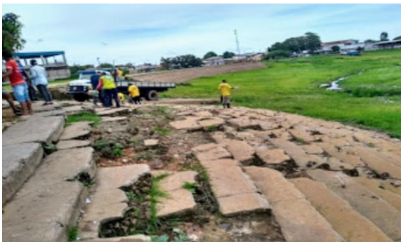
Fonte: Oliveira Filho, dez. 2019. Figura 18: Ação na orla da Francesa.