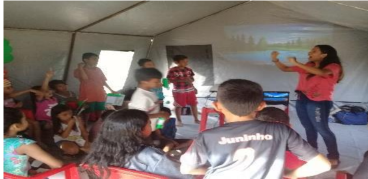
Figura 8: Registro no bairro da União.