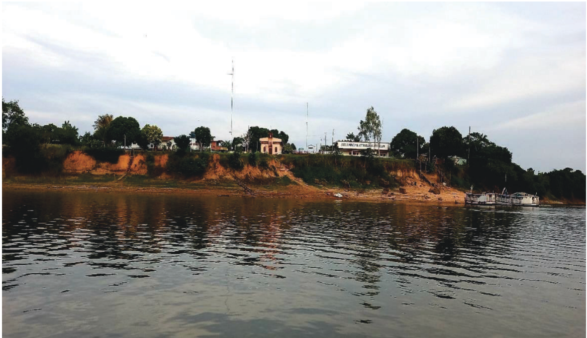
Figura 02: Frente da Comunidade do “Distrito do Pirai”