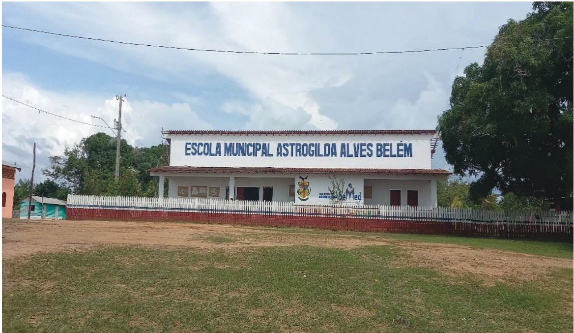
Figura 01: Escola Municipal Astrogilda Belém.

Fonte: Arquivo pessoal da acadêmica (2023).