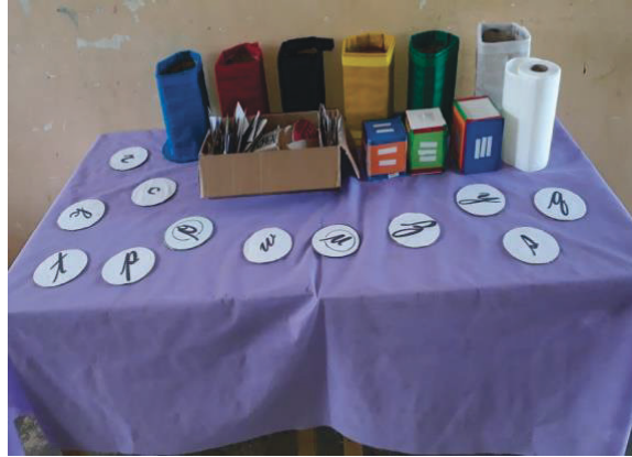
Figura 07: Conhecimento das cores e das letras.