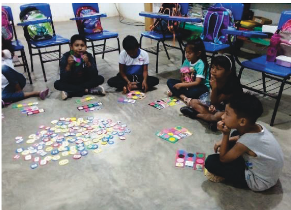
Figura 10 e 11: Formação de Palavras com silabas móveis.