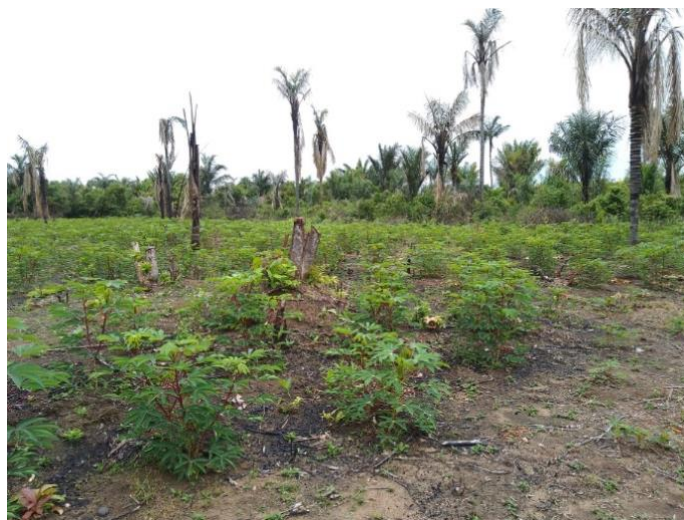
Figura 02 - Fonte: Walmir Vasconcelos – foto de uma roça

Segundo as palavras da Senhora Murici, “temos familiares nas várzeas e na terra-firme, vivemos nesse vai e vem de enchente e vazante, e aproveitamos para cultivar, até porque na várzea se faz uma roça que produz de 6 a 8 meses, a terra é mais fértil”, se observa todo um conhecimento do ecossistema Amazônico, conhecem os diversos produtos de acordo com a qualidade e tempo da terra mãe, por exemplo, a Senhora Maniva afirma que: “o período de produção na terra-firme é diferente, temos uma terra mais seca, não tem a umidade que tem na várzea, daí porque para fazer um roçado, dura em média de 12 a 16 meses.