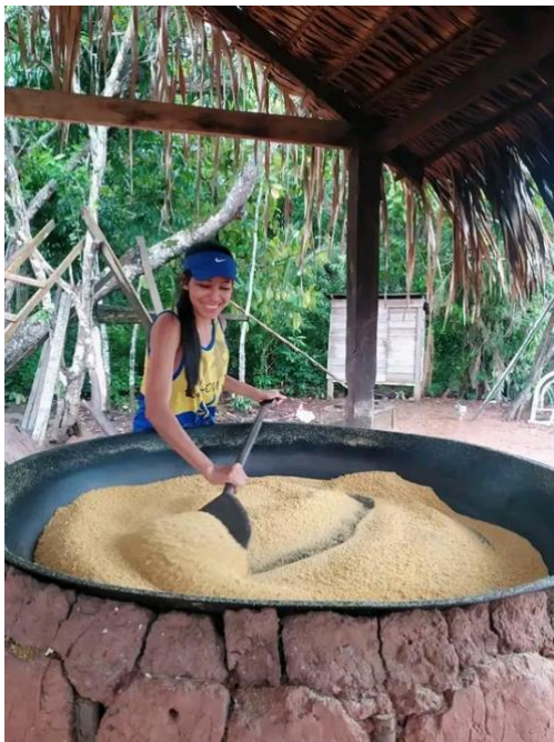
Figura 5: Mulher fazendo uma fornada de farinha na Vila da Brasília

Nesta imagem, temos o forno de torrar a farinha, o qual tem o formato de um círculo, a estrutura que mantém esse forno é de barro e feito um atracamento da parede do forno feito de madeira, a cobertura desse barracão de pequeno porte, é feito de palha colhida da própria região.