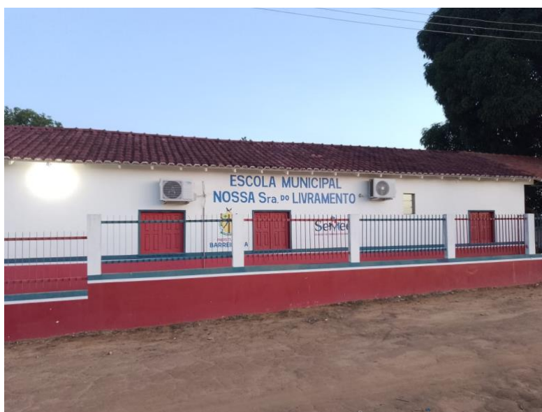
Figura 03 – Escola Municipal “Nossa Senhora do Livramento”

A religião católica é predominante no Distrito de Brasília Vila do Estácio, a padroeira é a “Nossa Senhora do Livramento” acima na figura 02 foto da Igreja.