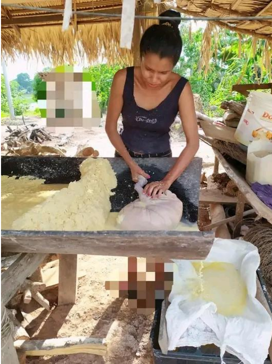
Figura 4: Mulher preparando a massa da farinha

Nesta imagem, temos o forno de torrar a farinha, o qual tem o formato de um círculo, a estrutura que mantém esse forno é de barro e feito um atracamento da parede do forno feito de madeira, a cobertura desse barracão de pequeno porte, é feito de palha colhida da própria região.