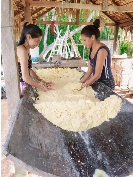
Figura 3: Processo de produção de farinha, mulheres na garera

Durante todo o processo de pesquisa, observando os detalhes da produção, e ao mesmo tempo as interrelações, destacamos que o humor, as brincadeiras, as piadas e causos locais, faz parte de toda essa conjuntura em torno no da produção da farinha de mandioca, se fortalecem as relações de compadrios, redes de confiança no outro, onde compartilham seus problemas do cotidiano, seus sonhos, suas expectativas,