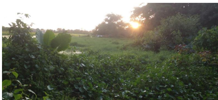
Figura 01: Área Antes Da Ocupação.