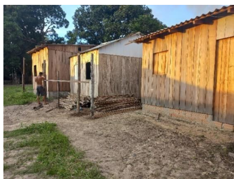
Figura 03: Tipos moradias.