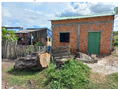
Figura: Primeiras moradias em alvenaria, com 04 cômodos.

Para (Lefebvre 2006, p.116) “o direito à cidade não pode ser concebido como um simples direito de visita ou de retorno às cidades tradicionais. Só pode ser formulada como direito à vida urbana, transformada, renovada”. A própria moradia é uma necessidade para a reprodução da vida que corresponde à necessidade de comer, vestir que está ligada à reprodução do econômica, que depende da força de trabalho. A relação com a reprodução das moradias está relacionada a crise da escassez e/ou precariedade habitacional.