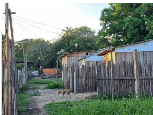
Figura 02: Via de acesso até as moradias.

As moradias são feitas de madeiras e alvenaria, tendo (1 a 4) cômodos, morando de 04 a 06 pessoas em um cômodo (figura 02 e 03), de 21 moradias 19 tem banheiros na área externa da casa, ressaltando as condições sociais dos moradores, relatando assim a falta de saneamento básico em relação as condições de precariedade, privacidade e segurança, visto que 50% das casas os quintais são as margens do lago Macurany, mostrando que os moradores futuramente possam vim a sofrer as consequências do fenômenos naturais como a enchente ou doenças que podem ser causadas.