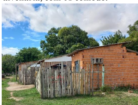
Figura: Primeira moradia em alvenaria, com 01 cômodo.