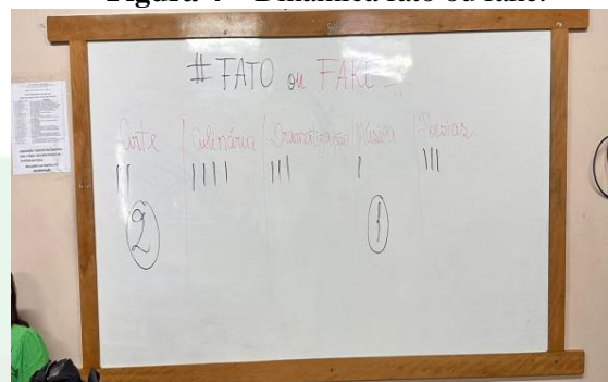
Figura 4 – Dinâmica fato ou fake.