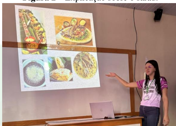
Figura 2 – Explicação sobre o sarau.