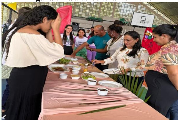
Figura 5 – Sarau cultural culinário.