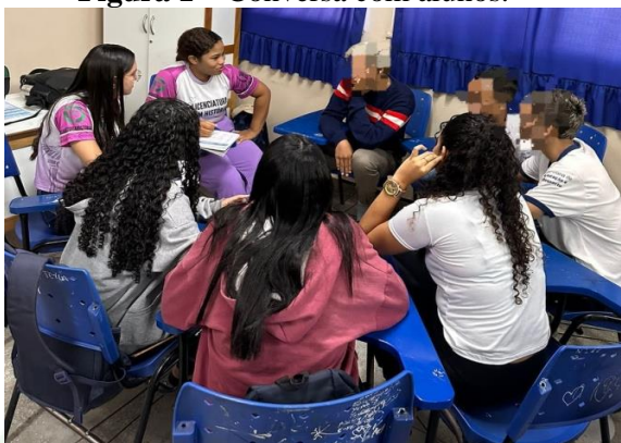
Figura 1 – Conversa com alunos.