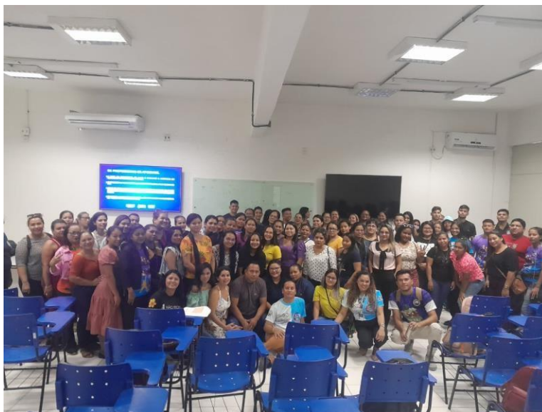
Figura 2 - Treinamento sobre Educação Especial e atividades emocionais para alunos

Fonte: Secretaria Municipal de Educação, Esporte e Cultura (SEMEEC)