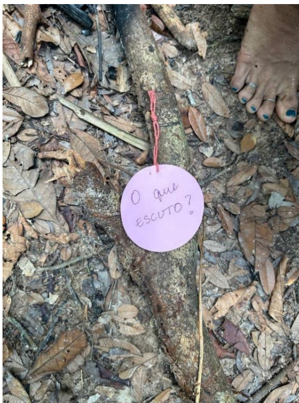
Figura 9: Segunda estação da trilha.

A terceira estação, “O que toco e o que me toca?” (Figura 10), levou a diferentes maneiras da percepção pelo toque, interagindo intencionalmente com os elementos do ambiente ou apenas permitindo que esses elementos tocassem o corpo, a floresta possuía partes mais abertas e outras mais estreitas que faziam com que as folhas passassem no rosto, nos braços e nas mãos, os galhos mais pontudos, as vezes, arranhavam a pele e prendiam nas roupas ou nos cabelos e era interessante tocar diferentes tipos de folhas, folhas secas que se desfaziam com toques e deixavam rastros escuros nas mãos, vestígios pelo corpo. Também foi instruído que, o corpo que sentisse necessidade de se movimentar e interagir com o local, era livre desde que observasse os arredores para evitar acidentes.