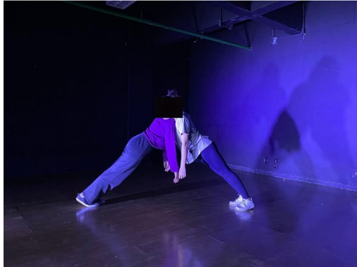
Figura 2: Imagem usada na divulgação do espetáculo (2024)

Com isso, aconteceu rodas de conversa onde o conceito do trabalho foi discutido e foi notou-se que durante as experimentações, o processo foi naturalmente alterado, agora ele envolvia tensões e apoios (Figuras 2 e 3), exploração da antecipação do movimento do outro e o que isso causava no corpo, o conceito do trabalho saiu desse lugar concentrado nos trabalhadores do porto e foi caminhando para uma percepção mais generalizada e em um contexto urbano, o nome (in)TENSÃO veio da ideia das tensões que surgiram em cena, das movimentações que tinham a intenção de segurar, agarrar e sustentar o outro, e nesse círculo de acontecimentos contínuo do processo que fazia o corpo chegar à exaustão.