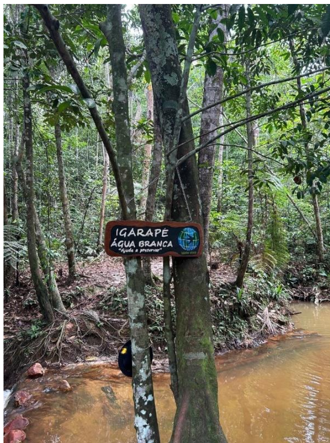
Figura 7: Igarapé Água Branca.

O segundo momento, consistiu em uma caminhada na trilha do Igarapé Água Branca (Figura 7), o grupo se concentrou e a professora passou os direcionamentos da atividade, primeiro a caminhada deveria ser lenta, cada passo construído lentamente no ambiente, mantendo consciência do que estava ao redor e mantendo a observação, por ser uma trilha em mata fechada, era necessário atenção nos momentos de interação com o ambiente, durante a caminhada haveriam diferentes “estações”, que eram diferentes perguntas elaboradas para serem exploradas ao longo da caminhada, com o intuito de estimular pensamentos, sentimentos, movimentações e interações com o ambiente.