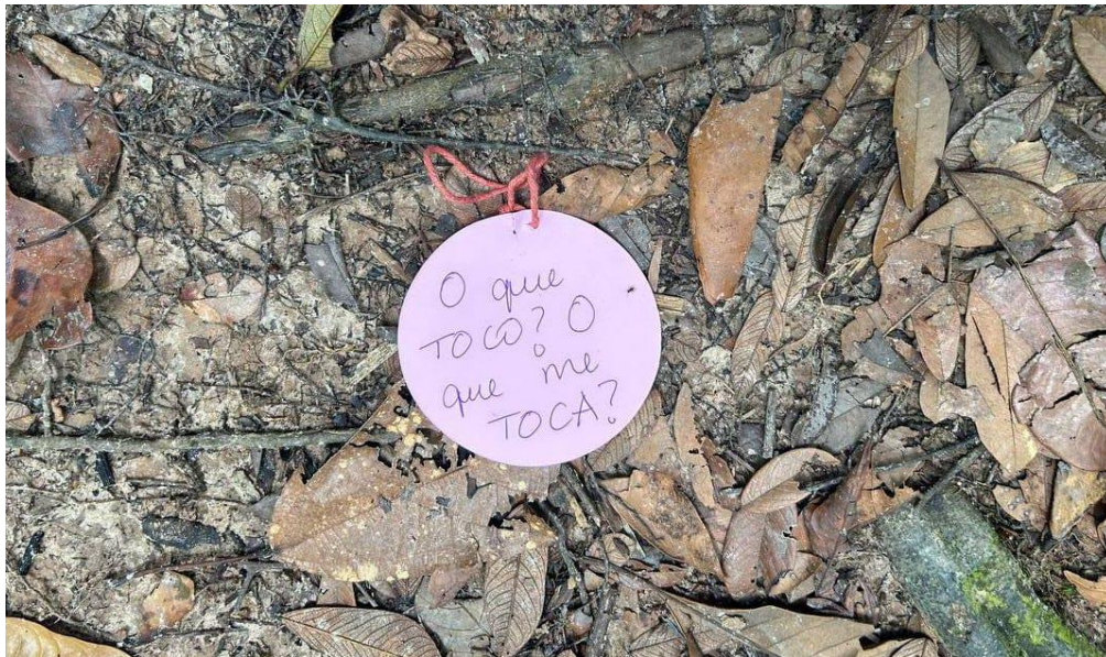
Figura 10: Terceira estação da trilha.