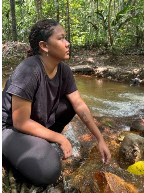
Figura 12: Beira do Igarapé.

Para concluir a fase das estações de dispositivos, as últimas perguntas foram “O que essa experiência me provoca enquanto processo criativo?” e “O que posso fazer com tudo isso?”, nesse ponto da caminhada a trilha havia acabado e o grupo foi convidado a pensar em como verbalizar o que foi vivenciado na caminhada e fazer um registro em um celular, o registro poderia ser gravado em forma de áudio ou vídeo, não era obrigatório gravar a si mesmo, poderia ser escolhido um ponto de interesse ou de observação enquanto a voz era gravada de fundo (Figura 13). As perguntas foram repetidas para que as ideias voltassem e pudessem estar mais claras, após esse momento, os integrantes do projeto foram direcionados para a última etapa da imersão.