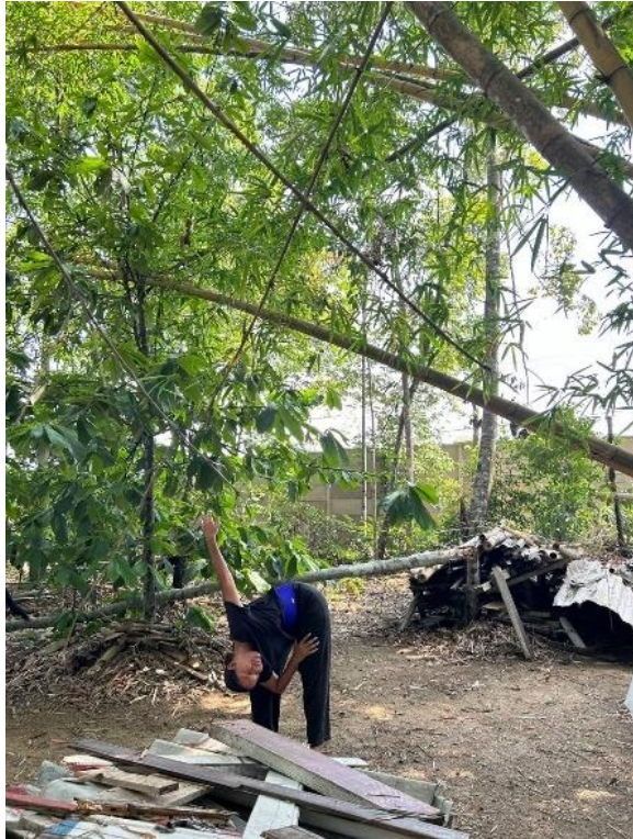
Figura 5: Alongamento no jardim.