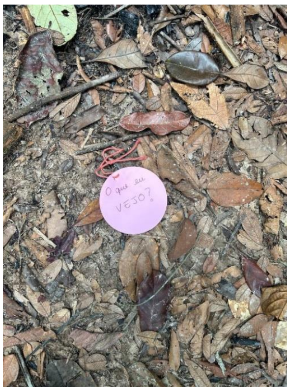
Figura 8: Primeira estação da trilha.

ao redor formavam um tipo de corredor natural que, apesar de ser organizado por pessoas, ainda conseguia ser denso e húmido, era muito similar as plantas na casa do projeto na sua forma de crescer e se expandir no local, formando essa cúpula de raízes e galhos, havia diversos emaranhados de diferentes plantas e cipós que se completavam, se contorciam e se tornavam a mesma coisa naquele espaço, diferentes insetos pequenos escondidos entre as folhas.