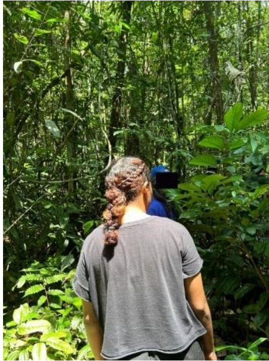
Figura 11: Caminhada na trilha.