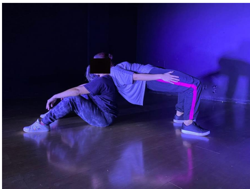
Figura 1: Movimentações que surgiram no processo da performance (2024)

“Imagino que as ações coreografadas distanciavam a ideia de entrega do corpo para as ações orgânicas e condicionavam ao pensamento de seguir um tipo de fluxo, tempo e ritmo, focando a atenção a uma ação planejada seguindo-a e não ao processo de construção.”