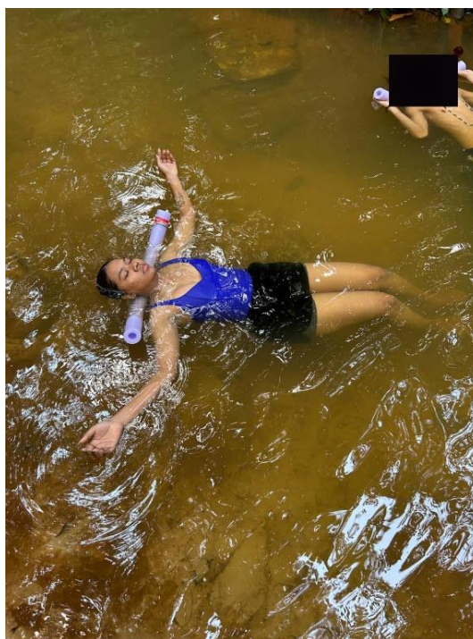
Figura 14: Imersão do corpo e autorregulação.

Escolhendo um lugar entre a areia e a água, iniciei pensando em movimentos lentos que me levassem para esse lugar de ondulações e reverberações, pensando na água e nas ondas que se formavam pelos movimentos que fazíamos dentro dela e nas diferentes texturas que poderiam ser encontradas dentro do igarapé, como areia e folhas, as pedras que também arranhavam as pernas nas movimentações, traziam essa ideia de algo mais rígido em contraste com a água fluída, a partir dessa ideia, fui experimentando aumentar as movimentações, aumentando a força e a velocidade, percebi meu corpo um pouco retraído em alguns momentos, se mantendo em movimentos pequenos e contidos, a professora instruía para aumentar as movimentações, a velocidade, construir movimentos amplos e mover o corpo, saindo do lugar escolhido e explorando o espaço. Após um tempo comecei a sair do local inicial e explorar mais movimentos dentro da água, tentando aumentar os intensões, acredito que o lugar mais convidativo se manteve na calma e tranquilidade de antes, era como se o corpo quisesse se manter nesse lugar de contemplação, com movimentações mais calmas ou poucas movimentações.