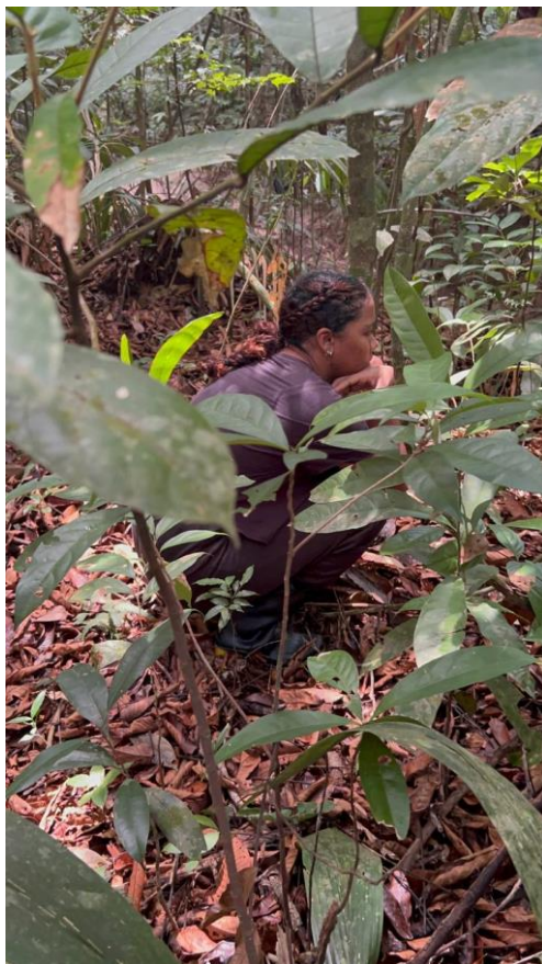
Figura 13: Momento de relato e reflexão sobre a atividade da trilha.