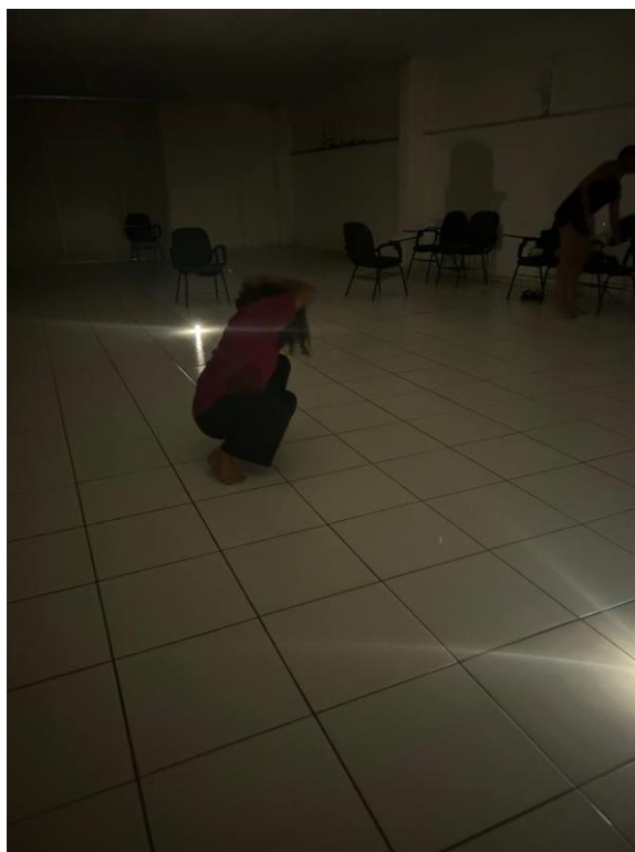
Figura 21: Improvisação no espaço.

regulação do corpo no espaço. Foi possível perceber que o ambiente proporcionou essa ideia de casa, conforto, proteção, voltando para a atenção de si e consciência corporal, o olhar para si.