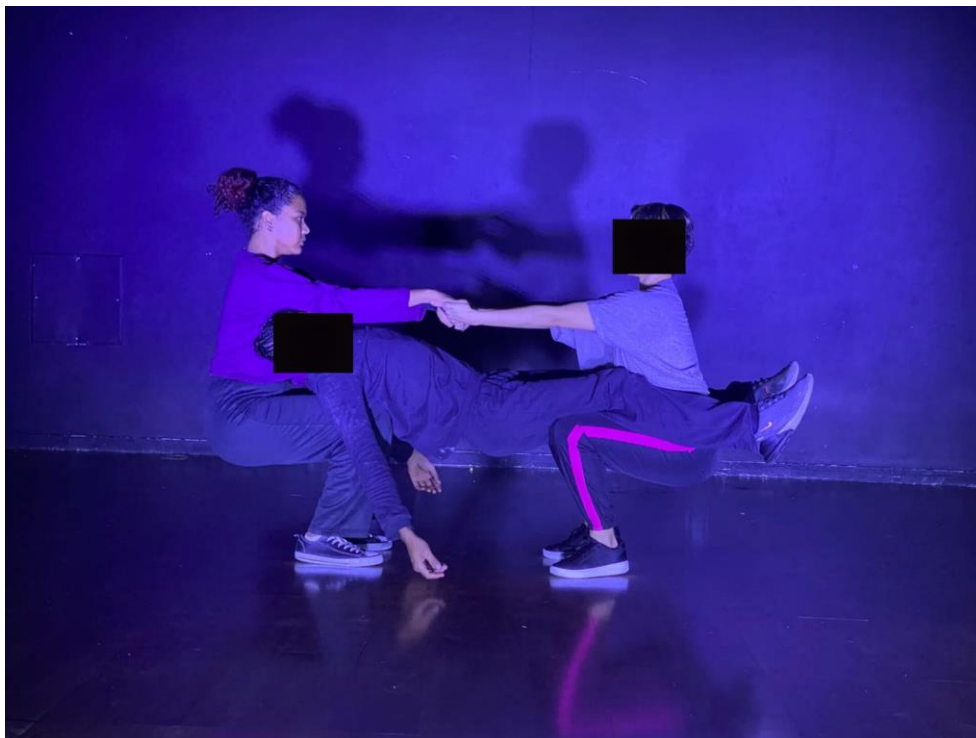
Figura 3: Movimentações que fizeram parte da performance (2024)

Para os ensaios da performance, foi estabelecida uma crescente com o objetivo de não cansar o corpo tão rapidamente, ao mesmo tempo que estabelece uma conexão dos envolvidos na cena, tanto o processo de criação quanto a performance também não possuía um tempo limite, as experimentações fluíam de sua própria forma e podiam durar de 20 a 50 minutos ininterruptos, notou-se nesse processo que quanto mais exaustos os corpos ficavam em cena mais movimentações e intenções eram percebidas não apenas pelos intérpretes, mas também pelo público que assistia a performance e pareciam se afetar pelos estados corporais dos bailarinos. A intenção na exploração da exaustão era proporcionar um movimento mais “cru” ao olhar, algo que se inicia internamente e vai se espalhando para a cena, os apoios se tornavam mais pesados e soltos, as quedas menos consistentes, esse cansaço tornava o corpo mais perceptível e ativo enquanto caminhava para o final da performance.