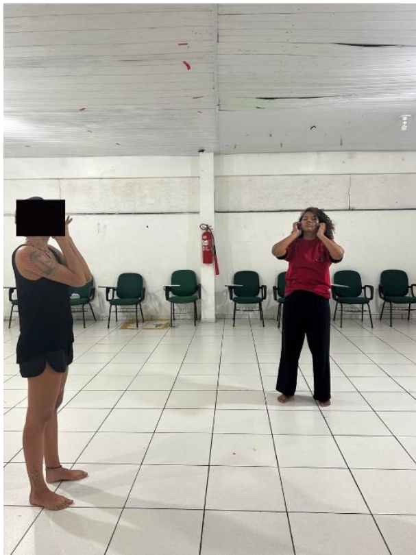
Figura 16: Início do alongamento e aquecimento do corpo.

“Foi interessante, perceber como a ação de mexer no rosto causa uma leveza e uma sensação que mesmo após um tempo ainda é possível sentir”.