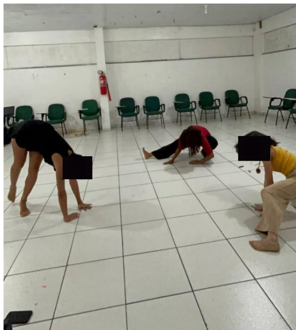
Figura 17: Alongamento das articulações.