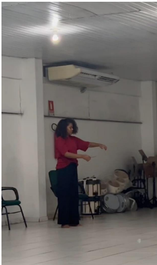
Figura 19: Defumação do corpo. Fonte: Vanessa Sofia (2024)

Conforme as movimentações cresciam, foram adicionados movimentos para se mover pela sala, explorando mais o espaço, foi destacado a busca pela compreensão desse movimento, os caminhos que ele seguia e as diferentes maneiras de executá-lo com o corpo, passando pelos planos, alto, médio e baixo. As luzes da sala foram apagadas e substituídas por pequenas velas artificiais que formavam um tipo de trilha (Figura 20 e 21), iluminando pouco os arredores e tornando a fumaça dos incensos mais visível, intensificando a observação, nesse momento com a sala mais escura, o próximo passo era se permitir brincar, pular, fazer movimentos que geralmente não são experimentados pelo corpo, movimentações incomuns. Durante toda a experiência foram colocadas músicas calmas que levavam o corpo para essa ideia de algo místico e distante da realidade.