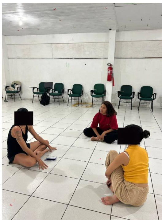
Figura 15: Momento de conversa sobre a dinâmica da imersão.