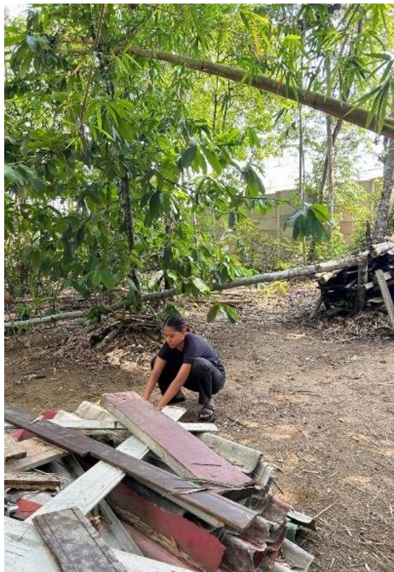
Figura 6: Interação com os objetos dispostos no ambiente.