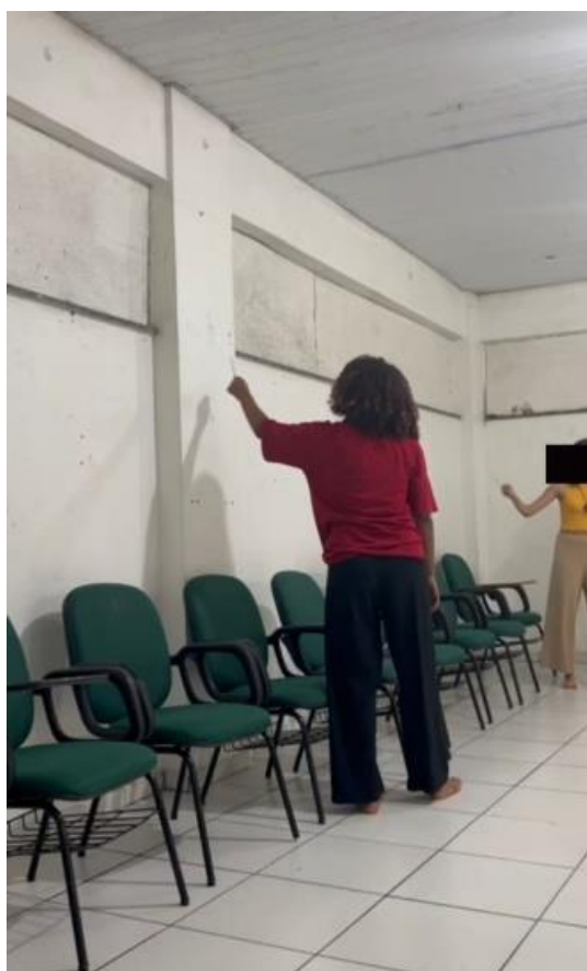
Figura 18: Momento de defumação da sala.

O próximo momento era de defumação do ambiente (Figura 18) utilizando incenso, descrevendo esse processo, Tainá pontua que para a cultura indígena, é um momento para limpeza do ambiente, e serve para conexão com os seres sagrados dessa cultura, através da fumaça que limpa e clareia o ambiente, o ato de defumação do corpo serve para trazer o corpo para outro estado de presença e percepção, uma forma meditativa de concentração. Para a defumação do ambiente, é preciso caminhar pela sala com o incenso defumando os quatro cantos da sala e observando os elementos presentes nela, seu estado físico, e trabalhando a autopercepção durante esse processo.