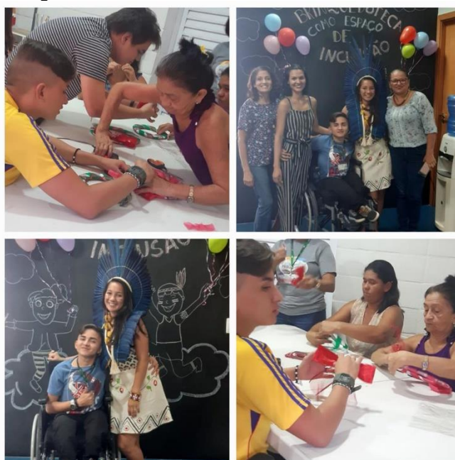
Figura 3 Fotos de diversas atividades do LEPETE

teóricos com os práticos, sendo assim uma porta de entrada para o mundo do trabalho pós formação acadêmica. Claro que nunca seremos “profissionais prontos e acabados”, mas a verdade é que quando o curso finalizar, é apenas o começo para uma busca incessante de melhorias como profissional da educação, por isso que a formação continuada é imprescindível nesse trajeto, para que formemos alunos críticos e reflexivos, precisamos sempre beber da fonte do conhecimento, compreender que sempre podemos melhorar na prática docente.