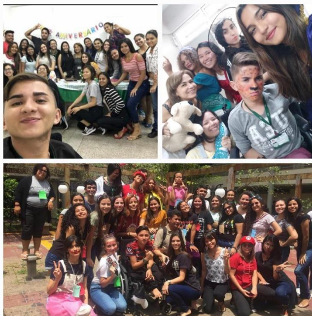
Figura 1 Fotos com a turma de Pedagogia da UEA

Em dezembro de 2019, eu recebi a confirmação que eu tinha passado no vestibular da Universidade do Estado do Amazonas-UEA e que iria ingressar na faculdade no Curso de Pedagogia. Fiquei muito feliz com o resultado, pois era uma Universidade pública que tem ótima reputação e meu sentimento era de gratidão pois eu era o único da minha família que ia ter um Curso Superior, alguém que um dia os médicos disseram que iria morrer ainda criança e que não teria muito tempo de vida. Porém, lá estava eu, todo feliz, em cima de uma cadeira de rodas, cheio de sonhos, com medos e aflito com o que estava por vir.