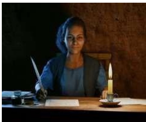
Figura 1: Imagem de Maria Firmina dos Reis.