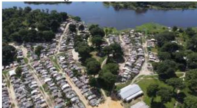
Figura 4: Bairro Castanhal

O bairro Castanhal fica localizado no município de Parintins, no interior do Amazonas. A cidade de Parintins é uma localidade que possui importante destaque em todo o contexto amazônico, seja na área da cultura, seja na economia da região norte. A cidade está localizada na região do Baixo Amazonas, e é sede do Festival Folclórico dos Bois-Bumbás Garantido e Caprichoso que acontece todos os anos no último fim de semana do mês de junho. Além de ser um dos mais importantes eventos culturais do Brasil, o festival folclórico é o principal gerador de movimento da economia no município, pois movimentava a renda local não só nas três noites de apresentação dos bois, mas durante alguns meses que antecedem e procedem a grande festa a céu aberto.