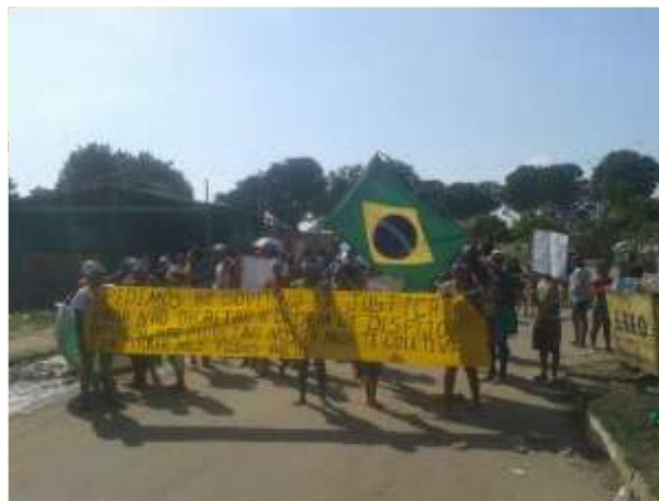
Figura 6: Reintegração de posse

Neste trecho fica evidenciado a luta enfrentada pela comunidade em meio a reintegração de posse ocorrida no ano de 2016, a ameaça de perda de suas casas e o constante medo da insegurança do lar. Como é relatado pela interlocutora, através de um ato de coragem as mulheres uniram-se em prol da defesa de seus lugares, formando uma corrente humana para proteger a ocupação da entrada abrupta e ameaçadora feita por parte do contingente policial. Em suma, nota-se que neste momento o que prevaleceu foi a união e a resistência dessas mulheres, que fortalecidas pelo coletivo marcaram a história do bairro Castanhal desde o início. Djamilia Ribeiro (2024, p. 85) nos diz que é “fundamental é que indivíduos pertencentes a grupos social privilegiados em termos de lócus social consigam enxergar as hierarquias produzidas a partir desse lugar, e como esse lugar impacta diretamente a constituição dos lugares de grupos subalternizados”.