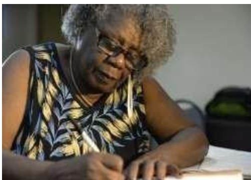
Figura 3: Escritora Conceição Evaristo