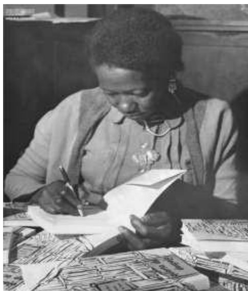
Figura 2: Escritora Carolina Maria de Jesus.