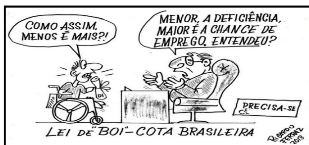
Figura 3 – Lei de “Boi”-Cota brasileira

Observa Matos (2017, p. 70), ainda, que “os empregadores preferem selecionar, dentre as pessoas com deficiência, aquelas que lhe são mais convenientes”. Isso significa que pessoas com deficiências mais severas não possuem política afirmativa que concretize sua colocação no mercado de trabalho, como se observa na figura 3.