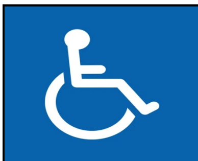
Figura 1 – Símbolo Internacional de Acesso (SIA)