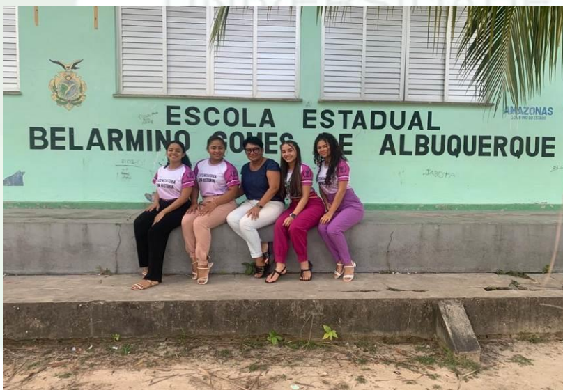
Figura1 - Prédio Institucional da pesquisa Belarmino Gomes de Albuquerque.

Por fim, em vista de tudo que já foi discorrido acima, será apresentado no decorrer deste trabalho uma breve análise fundamentada em alguns autores e nas experiências vivenciadas durante o estágio supervisionado I, um panorama contextual sobre o lúdico no ensino de História e quais resultados gerou.