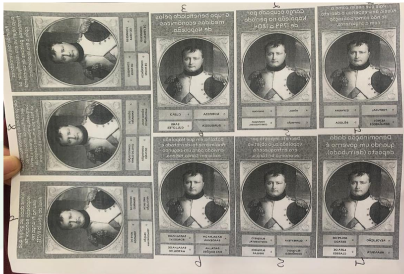
Figura 3 – Perguntas utilizadas no jogo relacionadas ao conteúdo da aula sobre “Era Napoleônica”.