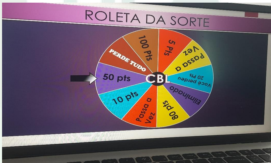
Figura 2 – Jogo utilizado como uma das ferramentas didáticas.

Mediante isso, notou-se a necessidade de um outro método educativo, que pudesse estimular o interesse educativo dos alunos, com auxílio de materiais como: Data-Show, notebook, brincadeiras e jogos educativos, foram realizadas atividades com os alunos baseadas no assunto da semana, sobre a (Era Napoleônica), com o auxílio do jogo educativo (roleta da sorte), utilizado para a estimulação do interesse dos alunos com a aula, foram feitas perguntas aos alunos sobre o conteúdo abordado na aula anterior, no jogo, a roleta era girada para indicar a quantidade de pontos que a pergunta a seguir valeria. Por fim, fora aplicado uma avaliação para os alunos, a qual o professor titular da disciplina de história atribuiria nota aos alunos.