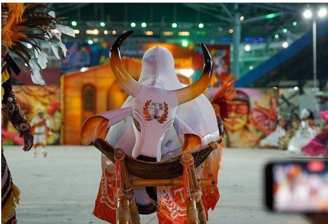
Boi Mirim Tupi durante apresentação no Festival dos Bois Mirins.

A primeira apresentação oficial do Tupi no Festival dos Bois Mirins ocorreu em 2006, marcando sua entrada no Bumbódromo e sua consolidação como representante cultural das crianças dos bairros mencionados. Em seguida, vieram grandes conquistas, incluindo os títulos de campeão dos festivais de 2007, 2008 e 2009, demonstrando a força estética e cultural do grupo. A formalização jurídica ocorreu em 07 de outubro de 2006, quando o boi passou a ser denominado oficialmente Associação Folclórica Boi Bumbá Mirim Tupi – AFBBMT, conforme registrado no portfólio institucional.