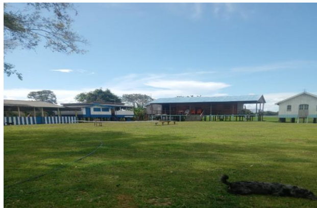
Figura 4: Quadro da comunidade. Ano: 2025

Com o passar do tempo a comunidade foi crescendo (ver figura 04), foi tendo escola (ver figura 05), igreja (ver figura 06), mas na medida do tempo, as pessoas iam saindo de lá em busca de melhores condições de vida para seus filhos. “E uma parte do povo que moraram ali já saíram, sobreviver em outras ‘parage’ devido a comunidade não disponibilizar de muito recurso e as pessoas queriam que os filhos estudassem mais” 44 . O cotidiano ali fazia as pessoas buscarem novos horizontes, principalmente em questão da educação, mas algumas pessoas ainda residem lá e mantêm firme a presença da família na comunidade.