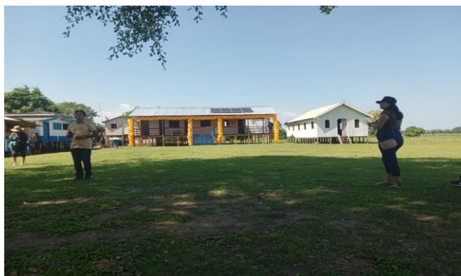
Figura 5: Escola da comunidade ao centro, atualmente passou por reforma. Ano: 2025