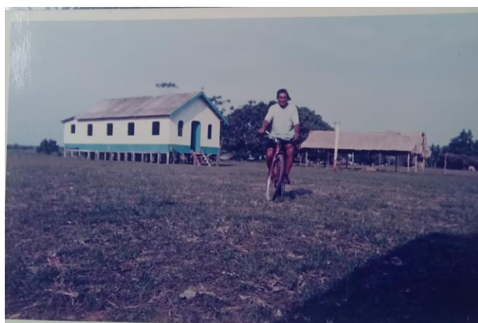
Figura 2: Vista parcial do quadro da comunidade, com destaque para igreja e Barracão. S/D.