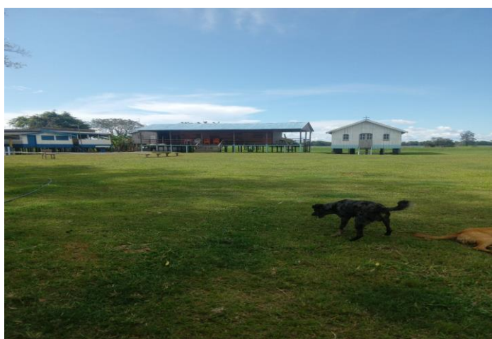
Figura 6: À direita da escola, a igreja de São Lázaro, padroeiro da comunidade. Ano: 2025