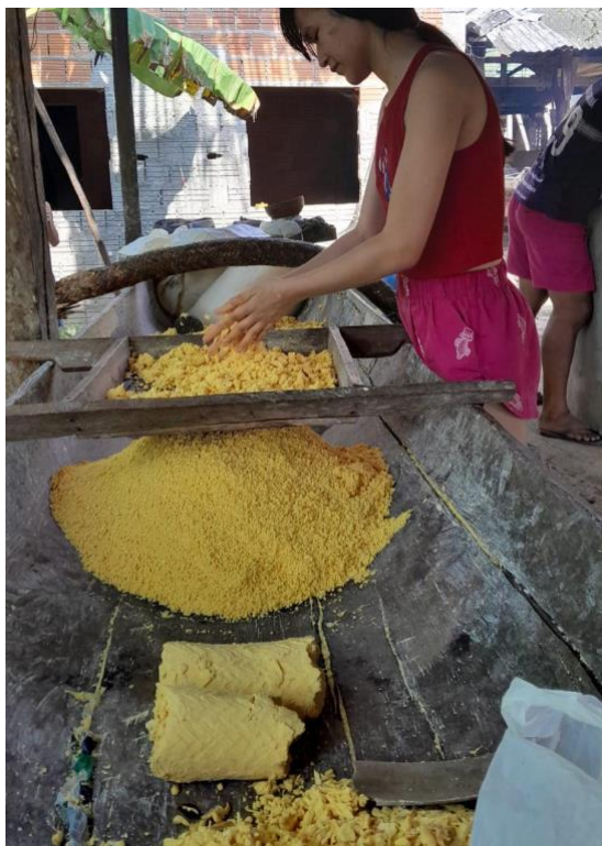
Figura 05: Produção de farinha.

região. A figura 05 ilustra esse protagonismo, apresentando uma jovem envolvida no processo de fabricação da farinha, um dos itens mais simbólicos da economia ribeirinha.