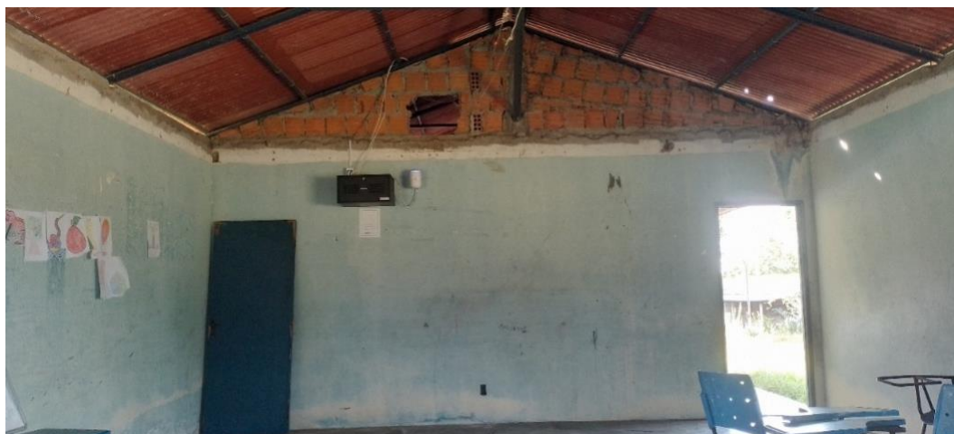
Figura 04: local de aprendizado na área indígena