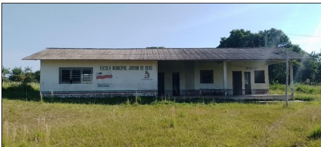
Figura 03: Escola Municipal Jardim de Deus