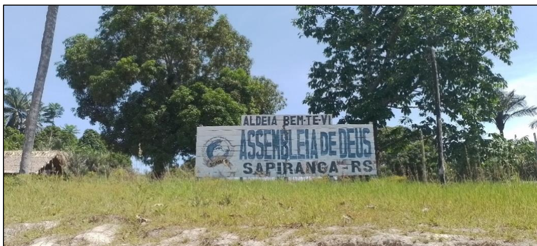
Figura 02: Registro da frente da Aldeia Bem-Te-Vi

Nos primeiros anos, a principal fonte de sustento era o plantio de mandioca e guaraná, produto tradicional da região que garantiu a sobrevivência e o fortalecimento econômico das famílias pioneiras. Com o passar do tempo, a comunidade foi se estruturando e diversificando suas atividades produtivas. Atualmente, uma das principais práticas é o cultivo de mandioca, destinada à produção de farinha, que se tornou uma das principais fontes de renda para as famílias locais.