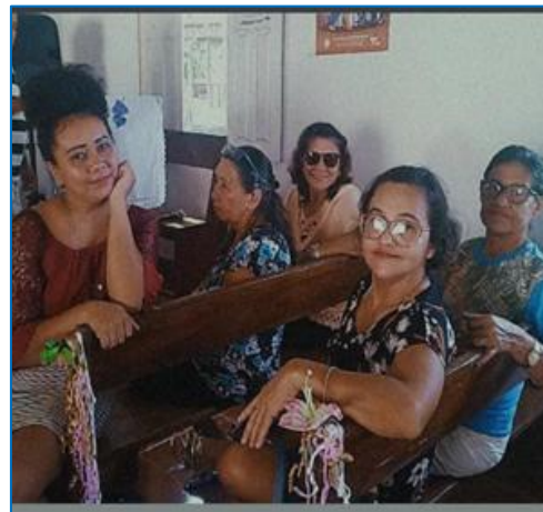
Figura 4 – Encontro de mulheres