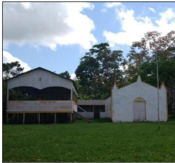
Figura 1- Comunidade Nossa Senhora da Paz - Costa da Conceição

Atualmente o conselho administrativo da comunidade conta com um presidente, um vice-presidente, um tesoureiro e um secretário 10 . A sede da comunidade fica localizada ao lado da igreja de Nossa Senhora da Paz e ao fundo há uma casinha onde guardam os mantimentos, bebidas e as comidas antes dos festejos. A igreja de Nossa Senhora da Paz é a única na comunidade a ser construída de alvenaria e suas cores branca e amarela, seguindo as cores do centro comunitário.