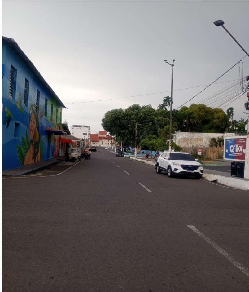
Figura 1: Rua / Praça Boulevard 14 de Maio