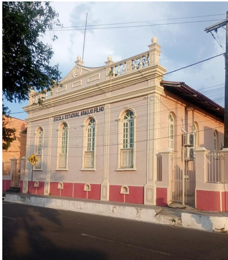
Figura 3: Escola Estadual Araújo Filho

Apesar do avanço da modernização e das constantes transformações no uso do solo, essas construções ainda resistem como elementos de memória coletiva. Suas fachadas ornamentada, janelas altas, gradis, porões ventilados e detalhes decorativos revelam técnicas construtivas tradicionais e modos de vida que já não fazem parte do cotidiano contemporâneo.