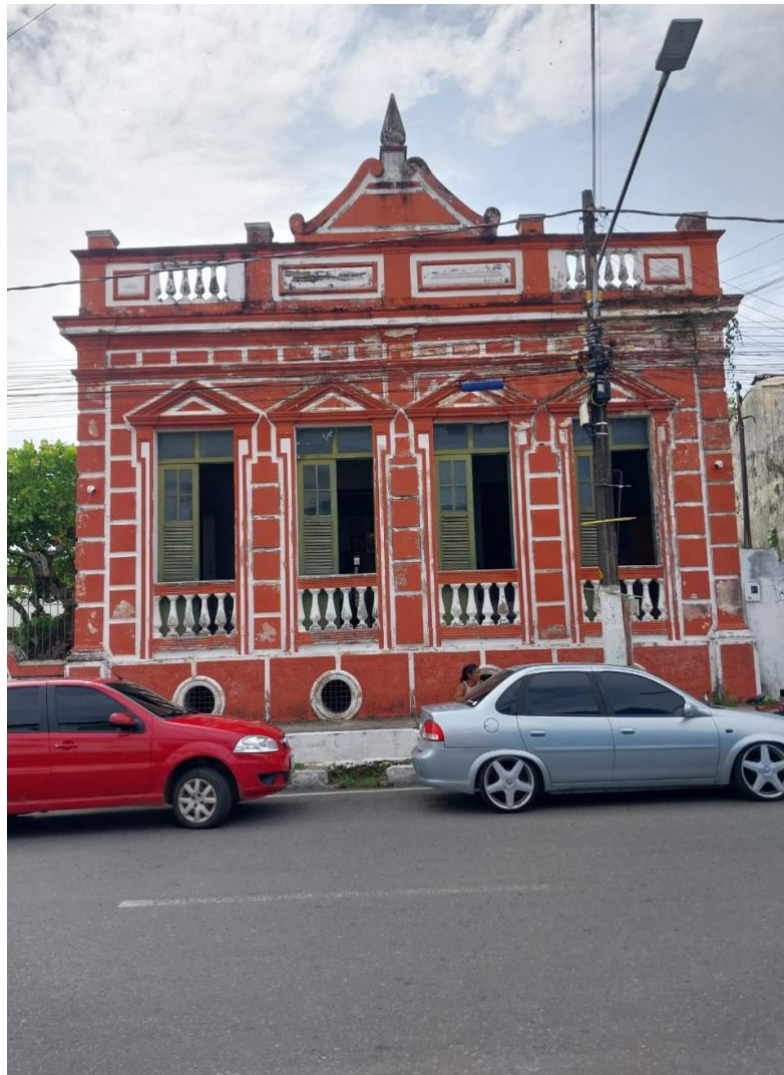
Figura 4: Casa das Maranhense