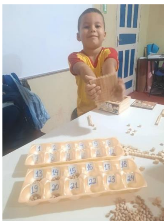
Figura 03: Quantidades numéricas

além das unidades de milhar e dezenas de milhar. Essa atividade estimula o aluno a contar quantas peças deve colocar em cada parte, desenvolvendo habilidades cognitivas, atenção, paciência e motoras. O objetivo é assegurar que a criança autista adquira novas competências, demonstrando sua capacidade de desenvolvimento e execução das práticas. A criança com TEA, de fato, mostrou-se capaz de realizar essa tarefa com êxito.