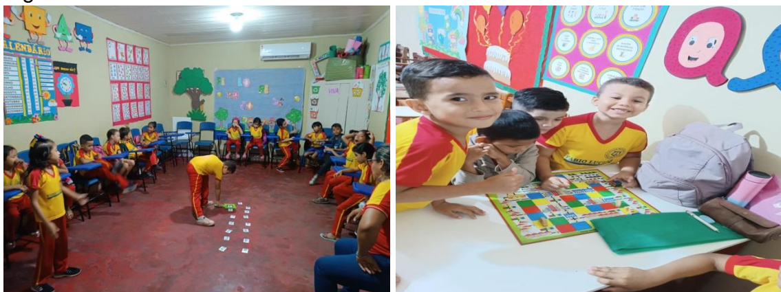
Figura 01: Ludicidade e inclusão

Fonte: Hanah Jéssica Mocambite Borges, 2023.