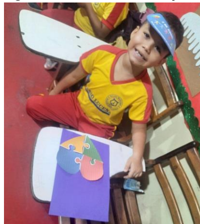
Figura 05: Quebra-cabeça

Nos jogos que envolvem memorização e decoração assim como movimento motor, o aluno mostrou-se mais habilidoso, devido que esses jogos envolvem estar em constante dinamismo para que as habilidades de manusear os objetos sejam bem eficazes. Um dos jogos que remete a isto é o jogo da memória e quebra-cabeça, jogos que envolvem estar em dinâmica e poder utilizar o cognitivo.